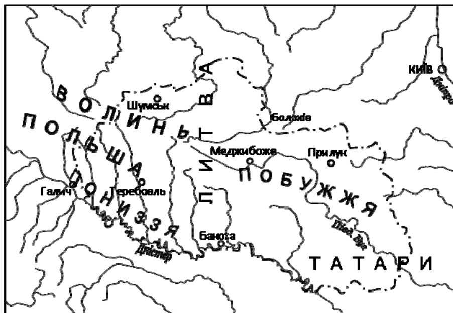
Рис. 1. Поділля у XIV ст.