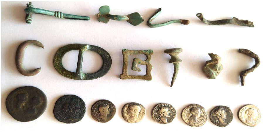
Рис. 5. Монетно-речовий скарб з с. Біли чин, 2023 р.