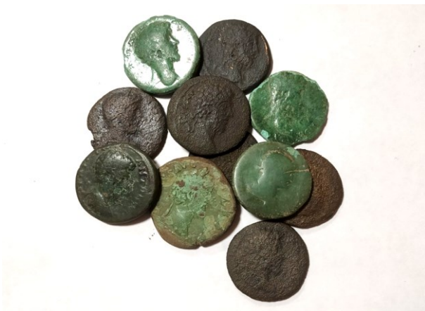
Рис.3. Скарб бронзових та мідних асів I–III ст. н.е. с. Міжліся, 2021 р. Вага 119,9 г

(177–192) з черняхівське поселення, м. Бар, 2023 р.