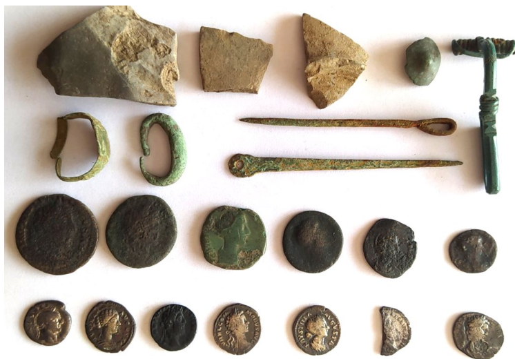
Рис. 4. Монетно-речовий скарб з с. Шершні, 2023 р. (фото О. Бакальця).