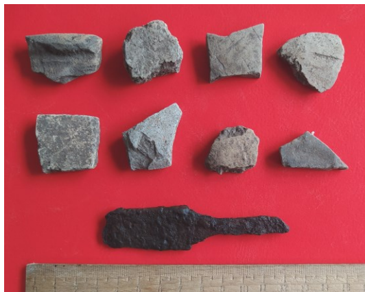
Рис. 1. Фрагменти ліпної та гончарної кераміки з черняхівського поселення в м. Бар Вінницької області. 2020 р.