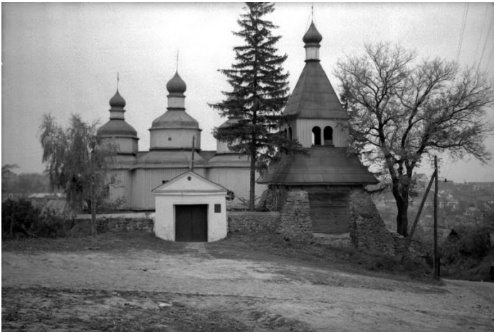
Іл. 3. Миколаївська церква. 1956 р.

Книга зберігається у фондах Вінницького обласного краєзнавчого музею [7]. На сьогодні це єдина відома авторці книга шлюбних обшуків з Вінниці в її межах перед революцією. У той період церковні треби для православних вірян, крім Миколаївської церкви, звершували Преображенський собор і церкви: Георгіївська (на передмісті Старі Хутори з присілками), св. Іоанна Богослова (Малі Хутори), Ікони Божої Матері «Всіх скорботних радості» (на території окружної психіатричної лікарні), Воскресенська (1910) і Вознесенська (1911) [8]. Крім того, було кілька безпарафіяльних церков – Казанська (1909), св. Володимира (полкова), домові храми при деяких навчальних закладах. Варто зазначити, що збереглося п'ять обшуківих книг 1857–1921 рр. Різдво-Богородичної церкви села П'ятничани, приєднаного в 1938 р. до Вінниці [9].