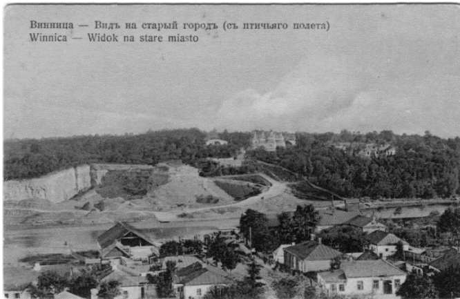
Іл. 1. Вінниця. Видял із середмістя на Старе місто. У центрі – Миколаївська церква. Поштова листівка, початок ХХ ст.