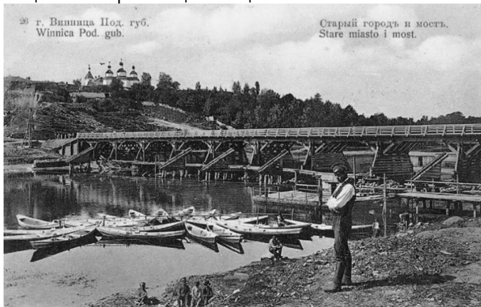
Іл. 2. Вінниця. Старе місто. Ліворуч височіє Миколаївська церква. Поштова листівка, близько 1910 р.

Об'єктом нашого дослідження є обшукова книга Миколаївської церкви – найстарішої збереженої церкви м. Вінниці, яка входить до переліку об'єктів культурної спадщини національного значення (пам'ятка архітектури, охоронний номер 020032). Ця тризрубна трибанна церква, опасана відкритою аркадою-галересю, збудована в 1746 р. у стилі українського бароко. Вона розташована в частині міста, яка орієнтовно з кінця ХVІ ст. і дотепер має назву «Старе місто». У багатьох документах до 1917 р., зокрема і в цій книзі, Старе місто виступає як передмістя Вінниці «Стара Вінниця», а його корінні мешканці – як «старовинницькі» міщани.