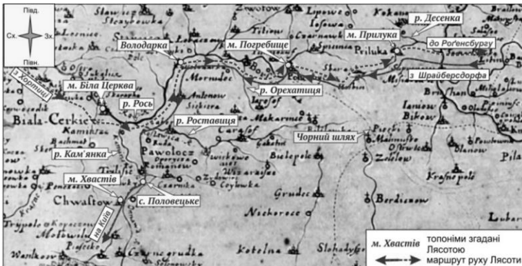
Мал. Маршрут руху дипломатичної місії Е. Лясоти навесні-влітку 1594 року теренами Верхнього Надросся (нанесений на карту Боплана [11])

Шлях австрійського посланця Е. Лясоти до запорізьких козаків, з метою їх найму, пролягав з Угорщини до Дніпра (Запорізька Січ) і у зворотному напрямку через Верхнє Надросся (мал.). Зупинимо увагу лише на тій частині шляху Еріха Лясоти, який пролягав від с. Прилуки (у той час містечка) до м. Хвастів по дорозі на Січ та від м. Біла Церква до Прилуки – у зворотному напрямку (мал.). Делегований посланець з супроводом здолав його упродовж 25–30 квітня 1594 р. (до Січі) та упродовж 14–18 липня того ж року (з Січі) [10]. Під час своєї подорожі Е. Лясота занотовував дату проїзду, відстань та особливі риси місцевості, зокрема її залюднення, стан природокористування, оборонні споруди, назви населених пунктів та річок. Загалом на цьому відтинку шляху автором щоденника згадується річка Рось та її ліві притоки (Орехатиця, Володарка, Березна, Сквирка, Роставиця та Кам'янка). Особливу увагу іноземний посол звернув увагу на містечка-замки із зазначенням імен і прізвищ їх власників. У Верхньому Надроссі до такого типу населених місць він відніс Прилуку, Погребище, Розволож і Білу Церкву. Окрім них – м. Хмільник і м. Пиків на теренах Брацлавщини та м. Хвастів на Київщині. Окремо ж зазначав села, як то Гуляки (поблизу Пикова), Половецьке та Ротулка (басейн р. Кам'янка, неподалік Білої Церкви)