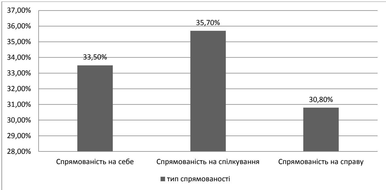
Рис. 1. Показники спрямованості підлітків (за методикою Б. Басса).

врахування думки всіх членів групи. «Відповідально-великодушний» тип міжособистісних відносин виявлений у 6,6% досліджуваних, що вказує на схильність респондентів брати на себе відповідальність за виконання певних справ, що швидше є свідченням і проявом їхньої великодушності, ніж прагнення як такого.