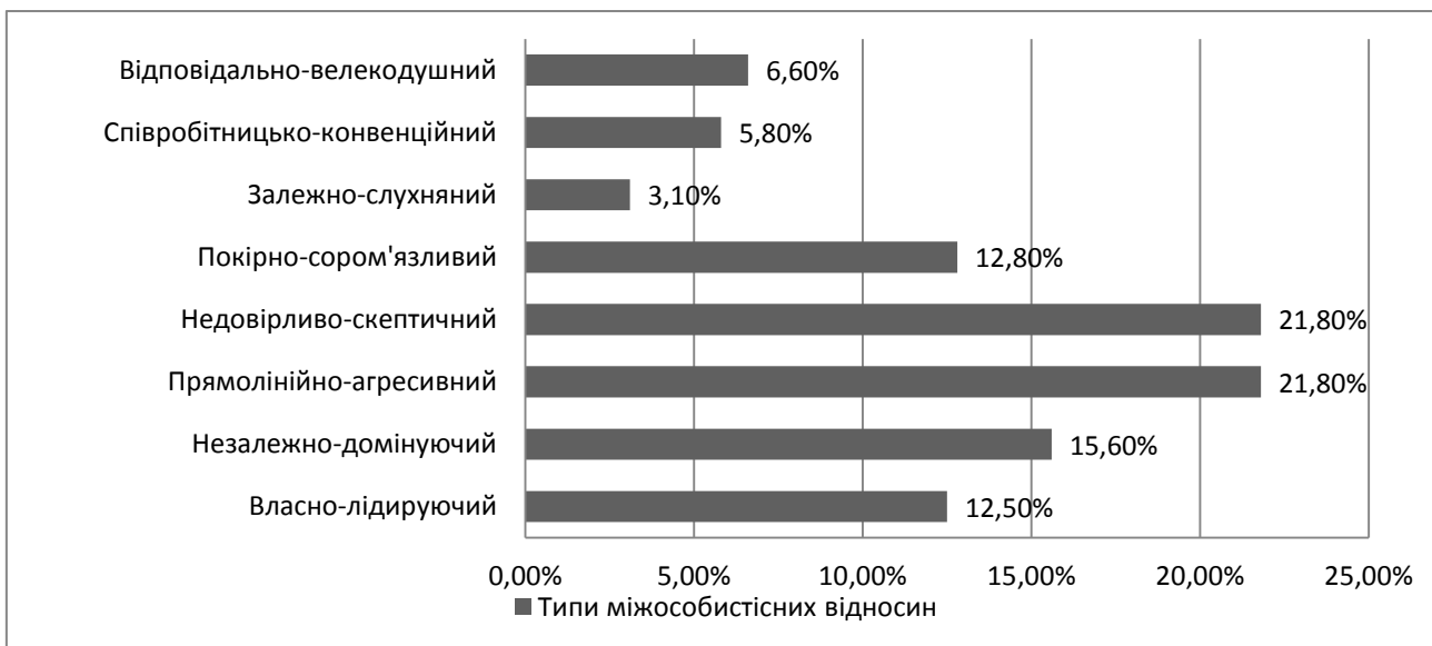
Рис. 2. Показники міжособистісних відносин підлітків (за методикою Л.Н.Собчик).

Показники міжособистісних відносин підлітків представлені на рис. 2.