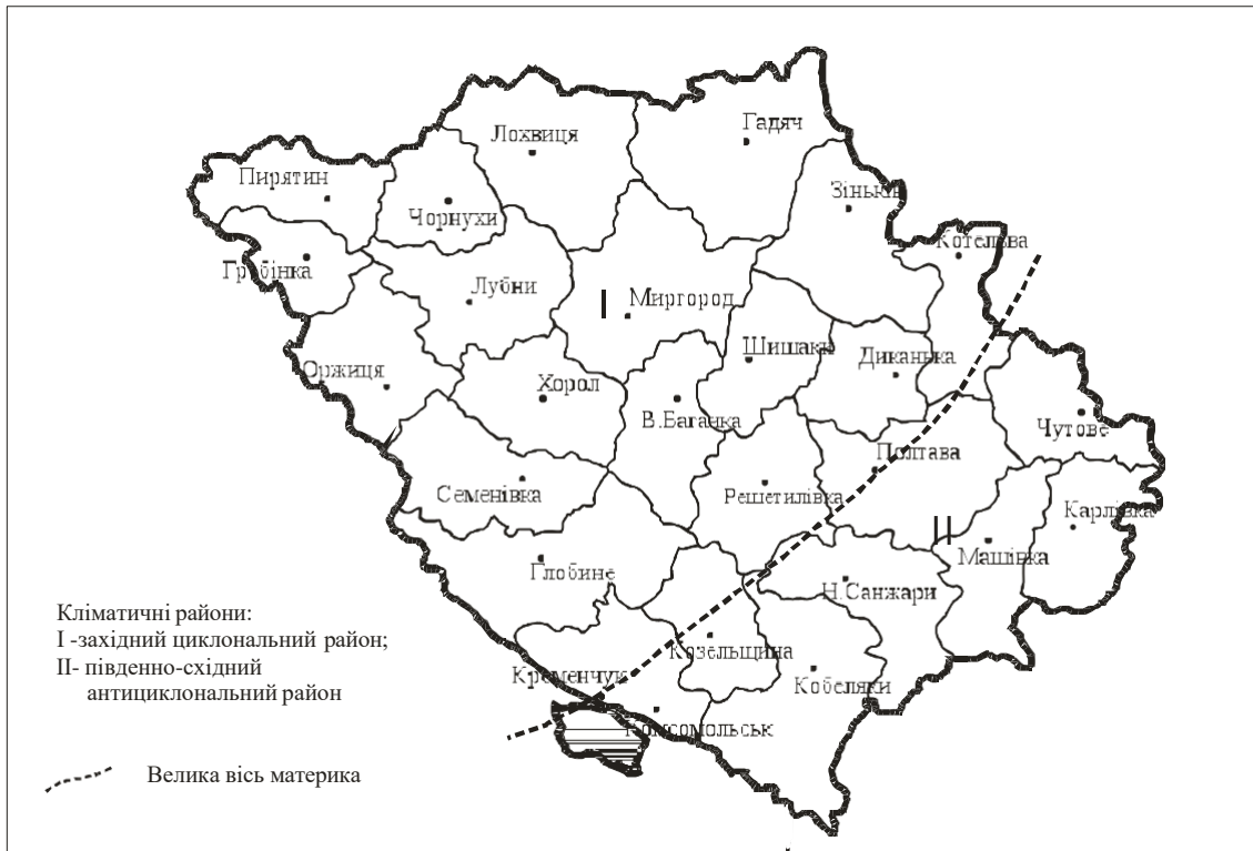
Рис. 3. Кліматичне районування Полтавської області

При поведенні кліматичного районування було враховано той факт, що через території Полтавщини по лінії Кременчук–Полтава і далі на Харків проходить вісь затропічного барометричного тиску (Велика вісь материка), яка є своєрідною вітродільною лінією. Ця вісь ділить область на дві частини: західну циклонічну, з переважанням західних і південно-західних вітрів, що приносять опади, і південно-східну з переважанням вітрів східних напрямів, які приносять сухе повітря [2]. Вітри інших напрямів бувають значно рідше. Тому при кліматичному районуванні на території Полтавської області можна виділити два райони: 1) західний циклонічний район , розміщений на захід та північний захід від Великої осі материка; 2) південно-східний антициклонічний район , розміщений на південний схід від осі (рис. 3).