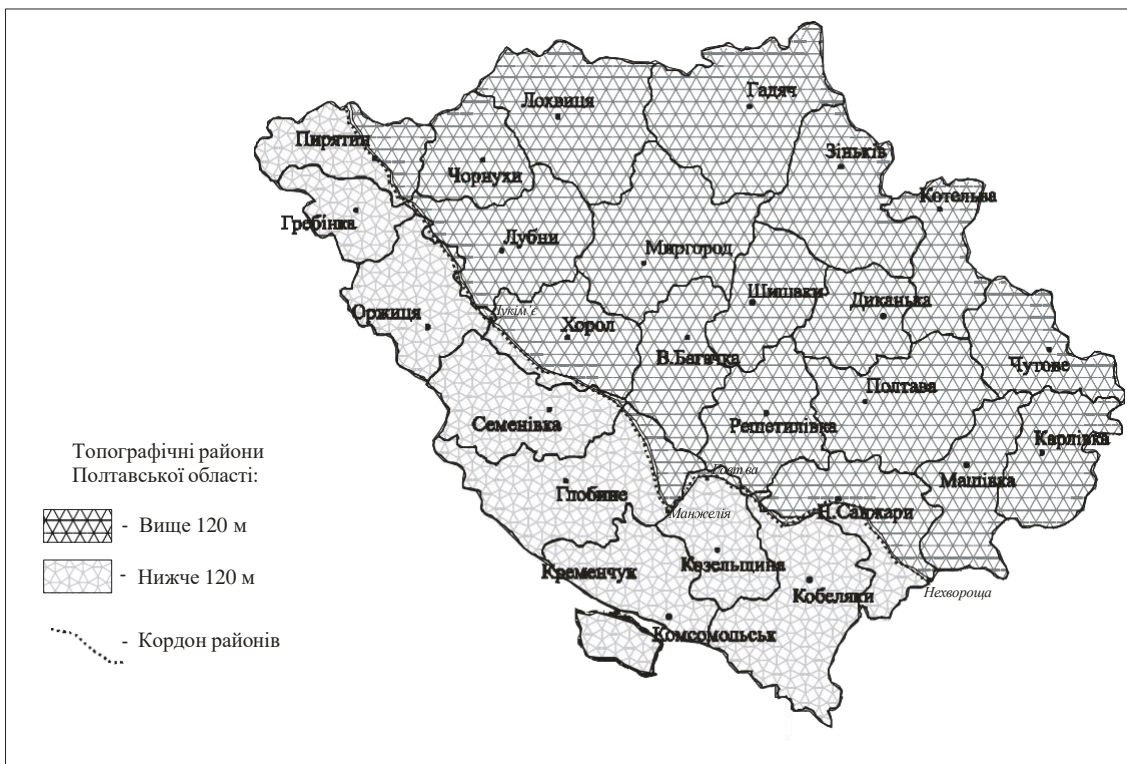
Рис. 2. Топографічні райони Полтавської області

Таким чином, рельєф території області відзначається своєю складністю. В цілому рівнинна територія області розчленована річковими долинами, сіткою ярів та балок, дислокаціями. Тому за геоморфологічною будовою Полтавську область можна поділити на два райони: 1) північно-східний – його висота над рівнем моря від 120 м і вище; 2) південно-західний – з висотами від 120 м і нижче. В основу поділу покладено районування Полтавської губернії за топографічною ознакою, проведене В.Ф. Ніколаєвим в 1923 році. [4]. Межа районів проходить по лінії Нехвороща (Новосанжарський район) – Нові Санжари – Говтва (Козельщинський району) – Манжелія (Глобинського району) – Лукім'є (Хорольського району) – далі на північ по річці Сліпорід, переходить на річку Удай і тягнеться до кордону Полтавської області. Виділені райони мають не лише різні висоти над рівнем моря, а також характеризуються відмінностями у розчленованості балками і ярами, характером чорноземів (рис. 2).