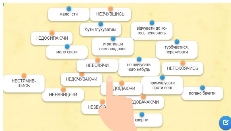
Рис. 3. Приклад вправи

Інтерактивні вправи на платформі LearningApps: здобувачі встановлювали відповідність між дієприслівниками з часткою не та їхні значення, групували частки за правописом, складали речення за темою, працюючи на онлайн-платформі.