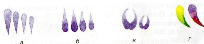
Рис. 1. Основні мазки периківського розпису:

а – «гребінчик», б – «зернятко», в – «горішок», г – «перехідний мазок»