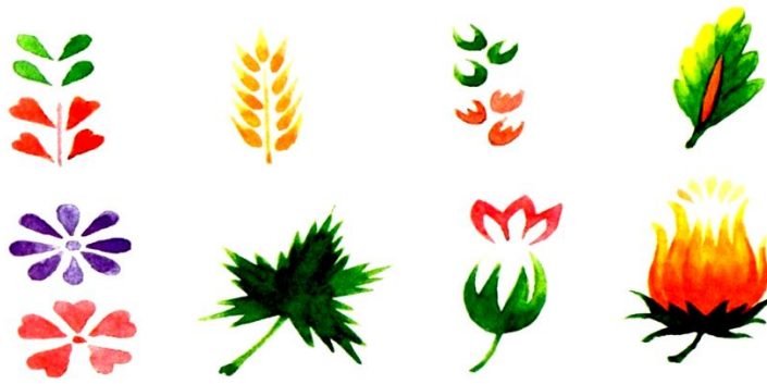
Рис. 2. Комбінації основних мазків

Вивчаючи петриківський народний розпис та його давні традиції, учні знайомляться з історією його виникнення, оволодівають технікою розпису в цілому, а також опановують окремі прийоми, які можна використовувати при виконанні композиційних малюнків. Одним із таких є прийом нанесення плям пальцем на папір. Торкаючись поверхні аркуша вмокнутим у фарбу пальцем, на ньому залишається кругленька пляма, трохи світліша в центрі з немовби темнішим контуром довкола (рис. 3, а). Поклавши в певному порядку подібні плями , можна зобразити гроно винограду, горобини, калини тощо [1; 3].