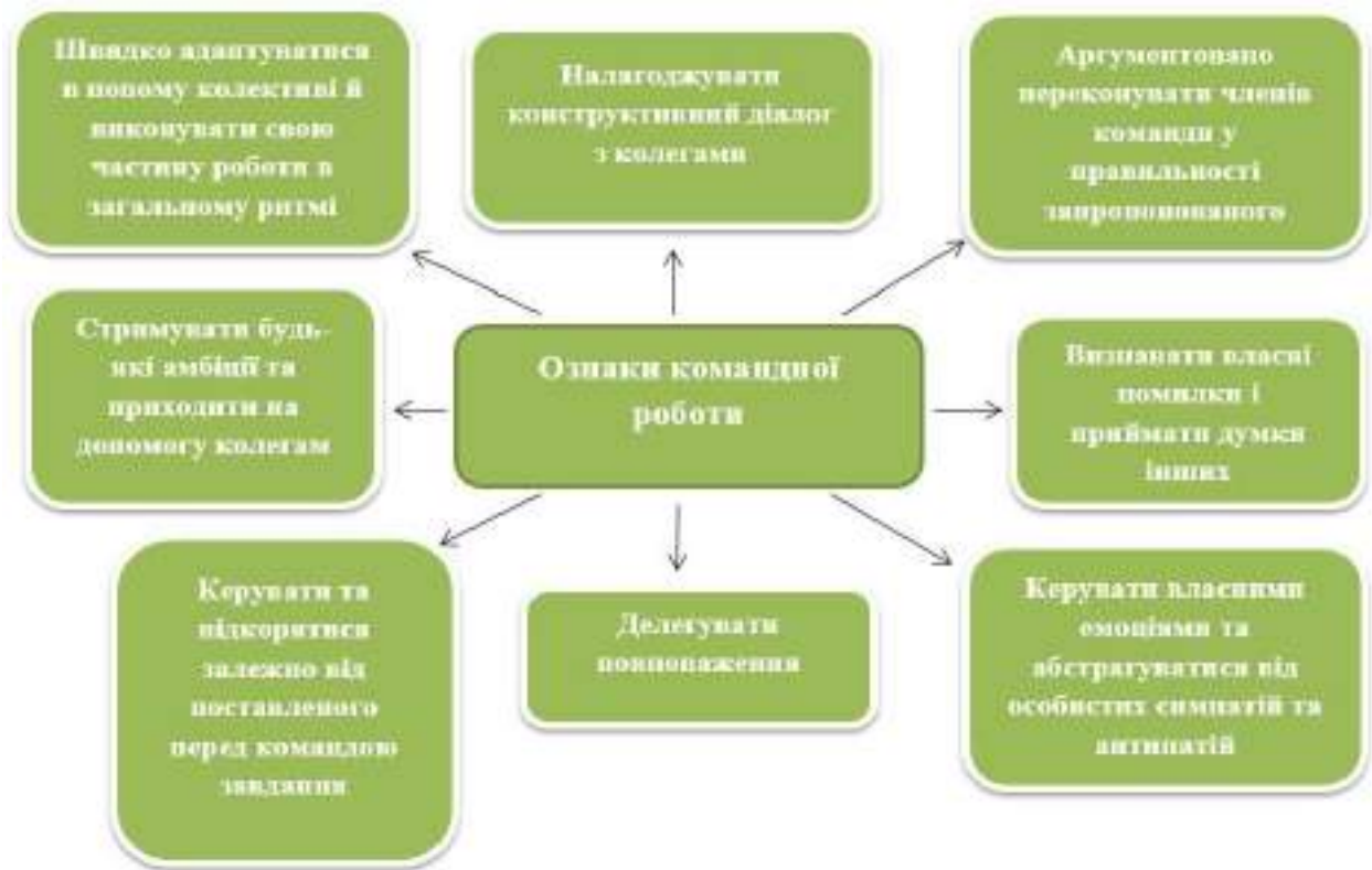
Рис. 2. Ознаки командної роботи, розробка Даніели Сірант