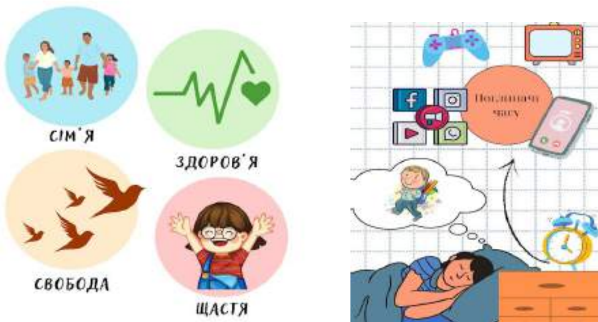
Рис.1. Творчі роботи Анни Бездітної