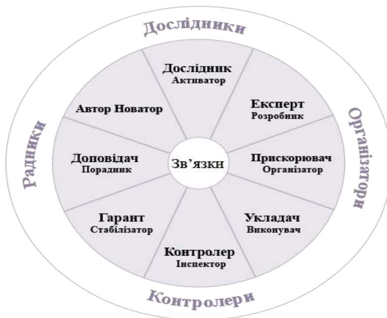
Рис. 1. Модель групових ролей «Колесо команди» Ч. Марджерісоном та Д. Маккенном