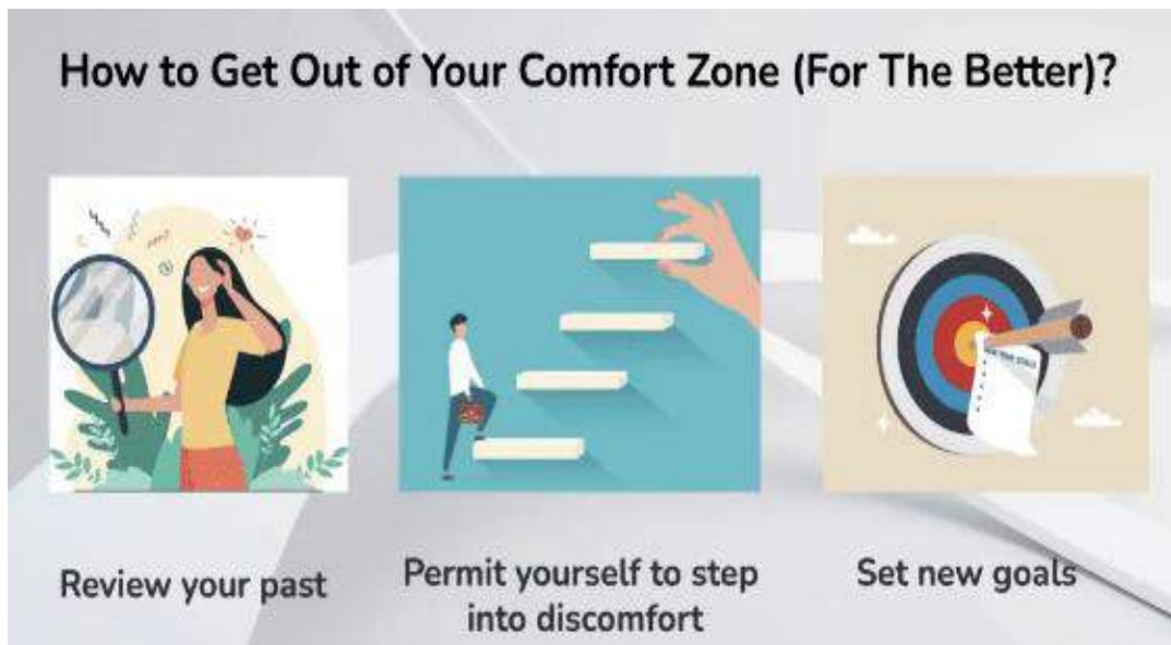
Рис. 3. Творча розробка Астрід Тран