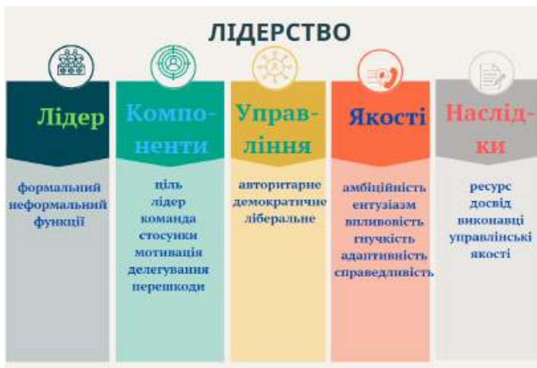
Рис. 2. Ментальна карта «Лідерство»