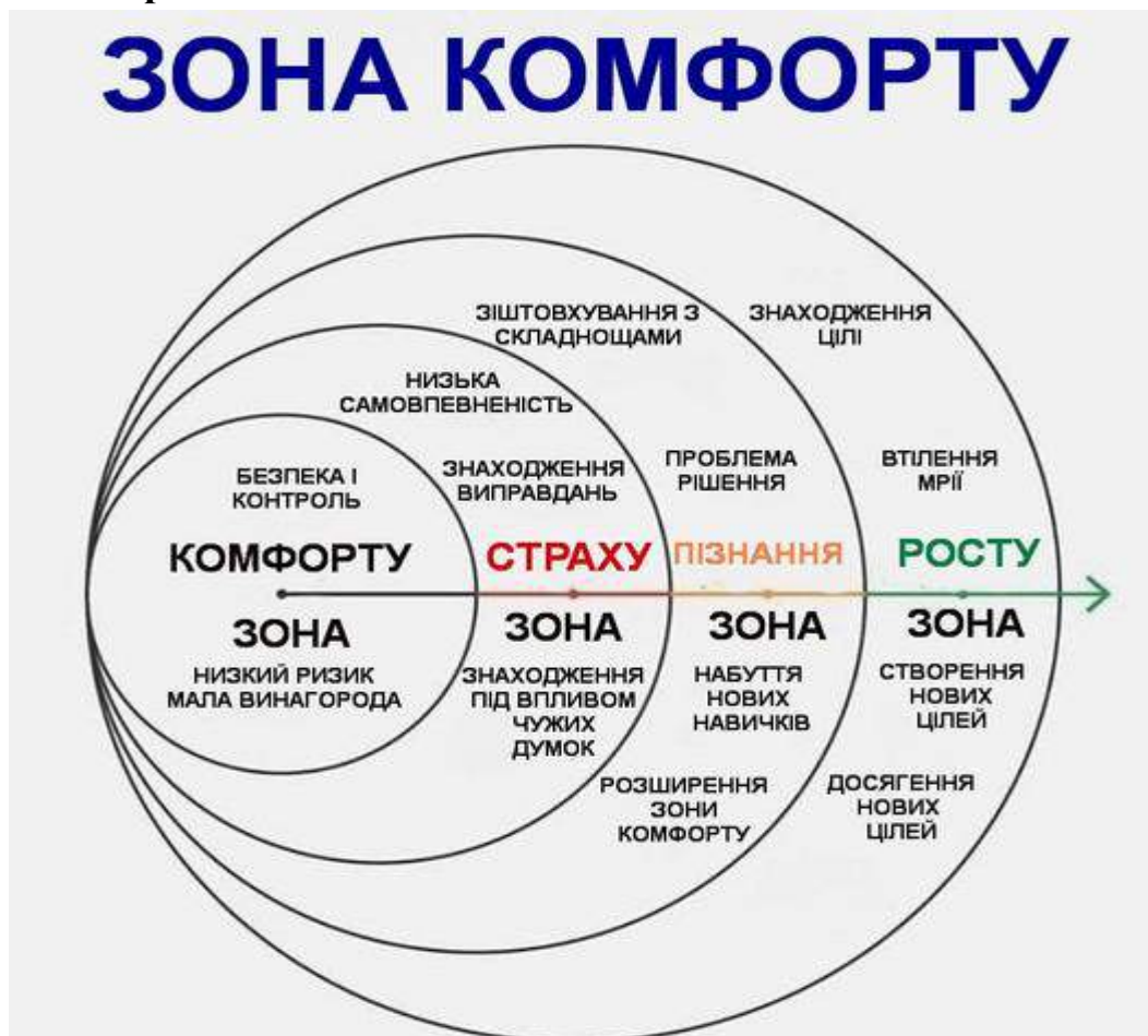
Рис. 1. Творча розробка психолога Оксани Скар