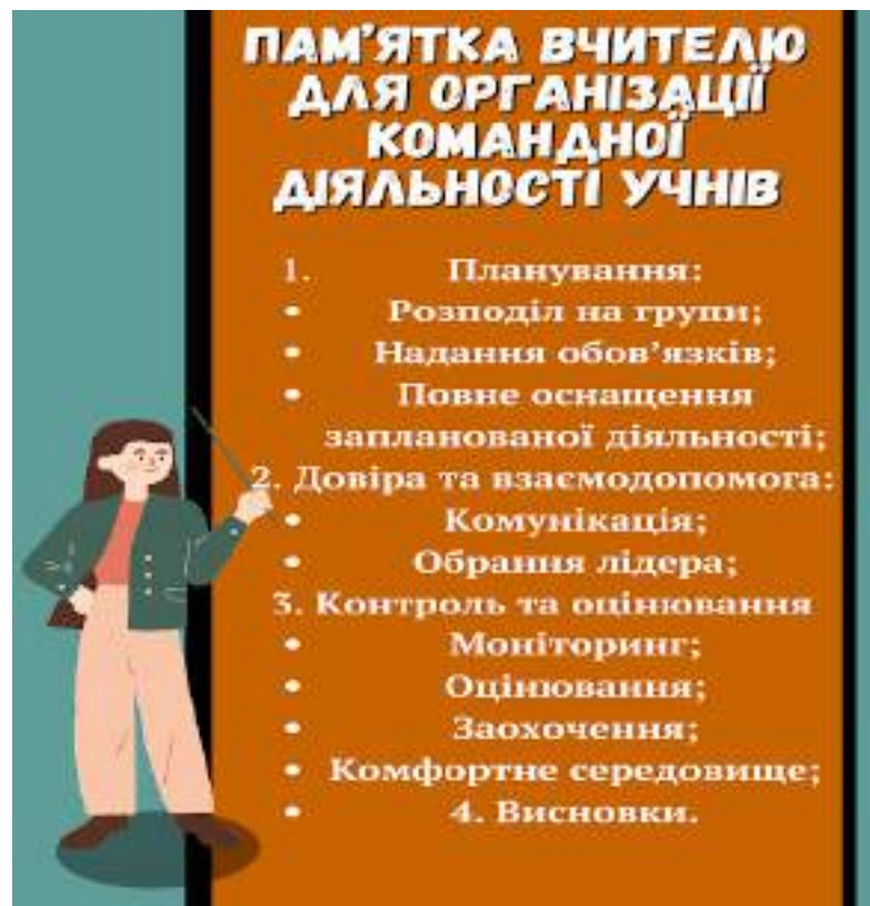
Рис 1. Творча робота Мар'яни Дзерен