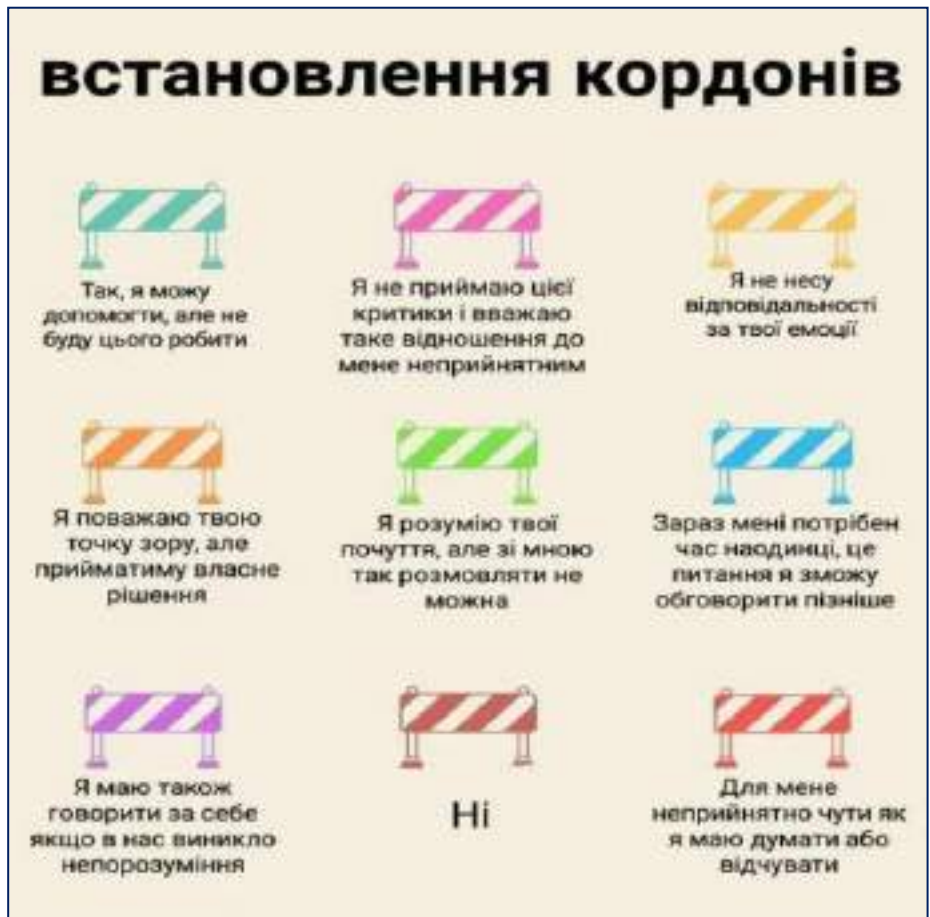
Рис. 2. Творча розробка психолога Оксани Скар