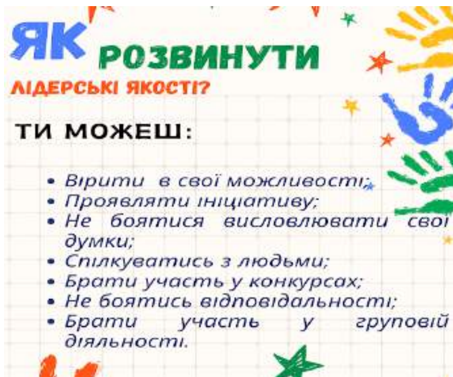
Рис. 1. Творча робота Анни Бездітної