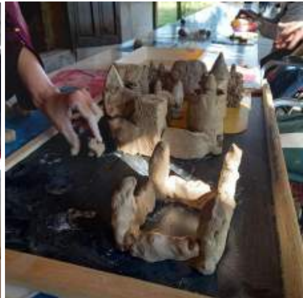
На фото: майстер-клас з глинотеранії. Ведуча психолог, арт-терапевт М. Рублевська. Територія Центру ремесел «ДУНСТАН».