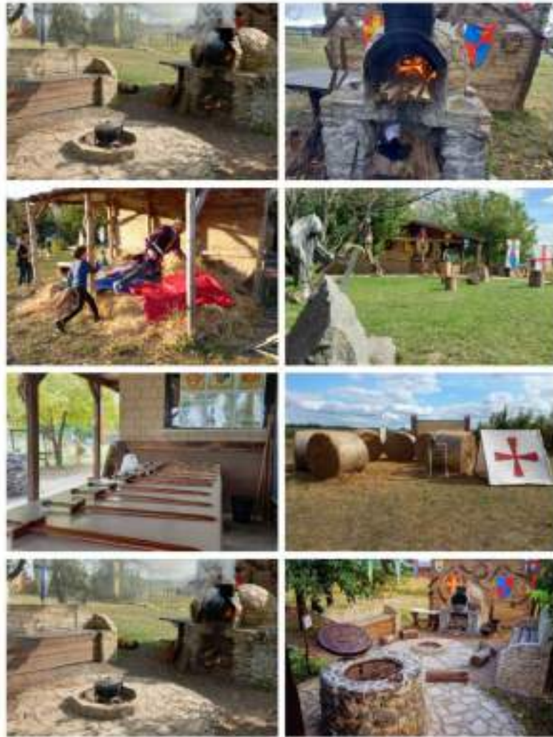
На фото: Територія Центру ремесел «ДУНСТАН».

Більше інформації про Центр ремесел «Дунстан» можна переглянути за спрямуванням на сайт організації за QR-кодом