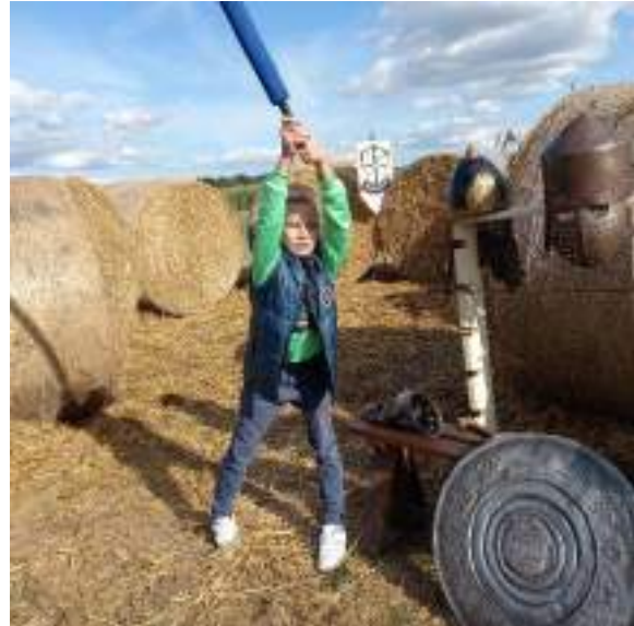
На фото: учасники проекту «Творчість лікує!» в лицарських обладунках та захопливих іграх. Територія Центру ремесел «ДУНСТАН».

Оволодіваючи лицарськими традиціями, духовністю, діти з інвалідністю одночасно й знайомляться з стилем, способом життя, діяльності й поведінки лицарів. Такий підхід сприяє формуванню у дітей з інвалідністю активно-дійової позиції у вирішенні складних життєвих ситуацій; розвиває ентузіазм і наполегливість у подоланні труднощів. Знайомство з лицарським способом життя стимулюватиме дітей з інвалідністю до пошуку можливостей виходити переможцем у життєвій боротьбі. Рівняючись на високий взірець лицаря, діти з інвалідністю оволодіватимуть лицарською ідеологією, філософією й мораллю.