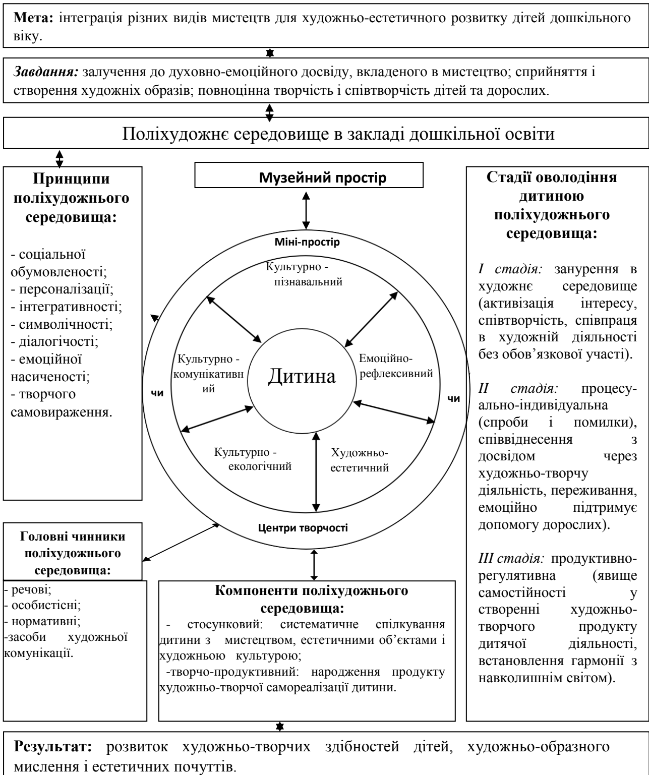
Рис. 1. Реалізація поліхудожнього підходу в художньо-естетичному розвитку дітей дошкільного віку

Представлений механізм реалізації художньо-естетичного розвитку особистості дошкільника в поліхудожньому середовищі, який базується на своєрідному культурному освоєнні цінностей світу, більшою мірою пов'язаний з естетичними емоціями і переживаннями, оцінками і діяльністю. Він