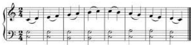
Мал. 1. Пісенька про гаму До мажор.

Десь зі столу впало сало, сало мишка підбрала.