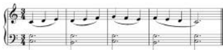
Мал. 2. Качечка, гілочка, квіточка, білочка, стоп.

Дітям властива фантазія, без якої не можливо стати хорошим виконавцем. Творчі вправи, пов'язані з розвитком ритму тренують ритмічну пам'ять, розвивають координацію рухів, тому в даній праці найбільше уваги приділяється образним вправам, пов'язаним з мовою і співом.