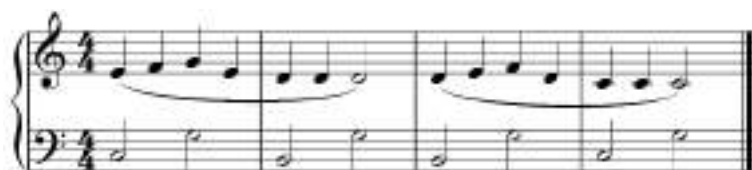
Мал. 8. Жук з жоржиною дружив, у жоржині їв і пив.

На початкових етапах музичних занять у дітей виникають труднощі з нерозумінням того, як працює музичний метр. Проблема частіше всього пов'язана з відсутністю навичок визначення сильної долі. Для її вирішення важливо займатись ритмічними вправами зі словами, наголоси яких випадають на першу долю. Так само визначити сильну долю допомагають повторення однакових ритмічних груп, які як правило присутні в більшості мелодичних ліній.