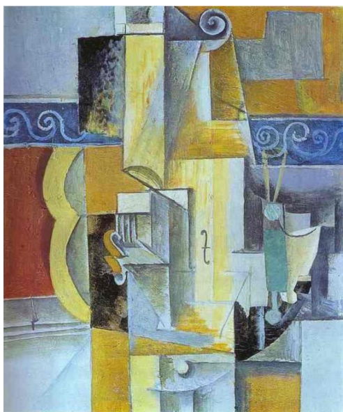
Рис. 1. Пабло Пікассо (1881-1973). «Скрипка та гітара», 1913. Олійні фарби, полотно

Особливо яскраво роль форми у створенні художнього образу проявилася в мистецтві модернізму. Художники цього періоду відійшли від традиційного наслідування природних форм і почали експериментувати з власною мовою формотворення. Кубізм Пабло Пікассо (рис. 1) та Жоржа Брака (рис. 2) продемонстрував можливість розкладання природних форм на прості геометричні елементи, створюючи новий тип реальності з множинними точками зору. Формальні експерименти авангардистів відкрили шлях до абстрактного мистецтва, де форма повністю втратила свій предметний характер і стала самоцінним елементом.