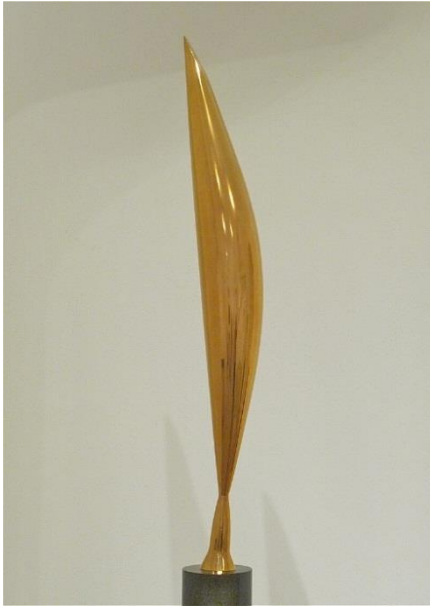
Рис. 3. Константін Бранкузі (1876-1957). «Птах у просторі», 1923. Матеріал: бронза

У скульптурі форма набуває особливого значення, оскільки тривимірність цього виду мистецтва дозволяє глядачеві взаємодіяти з твором у просторі. Роботи Константіна Бранкузі демонструють, як максимально спрощені, очищені від деталей форми можуть передавати сутність об'єкта більш виразно, ніж реалістичне зображення. Його «Птах у просторі» (рис. 3) зводить форму птаха до витонченої вертикальної лінії, що уособлює ідею польоту, а не його фізичне втілення.