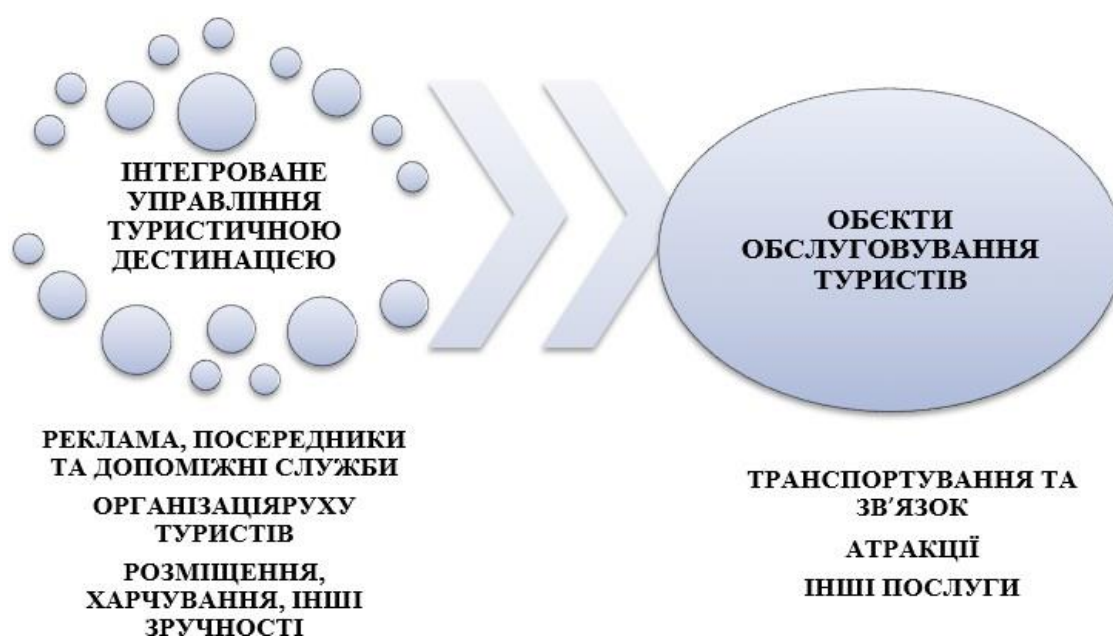
Рис. 2. Управління системою об'єктів туристичної дестинації