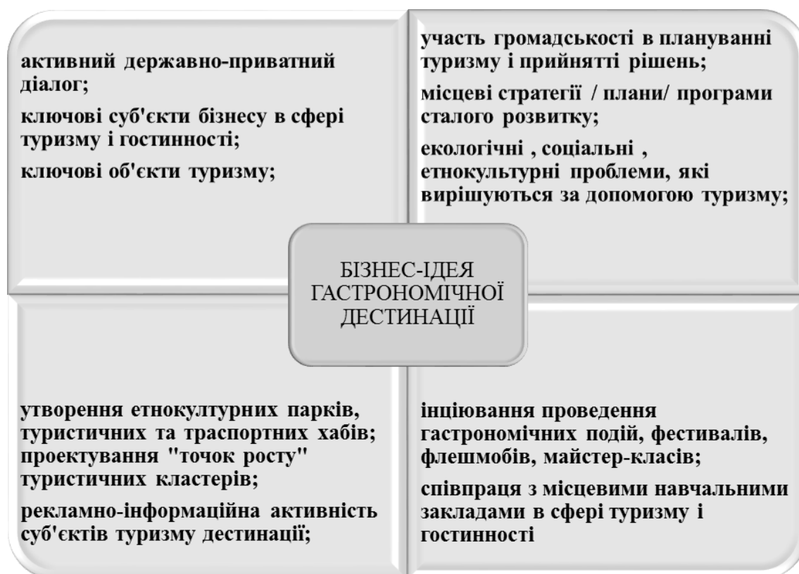
Рис. 3. Матриця критеріїв утворення гастрономічної дестинації

Критерії утворення гастрономічної дестинації представлені у вигляді матриці (рис. 3).