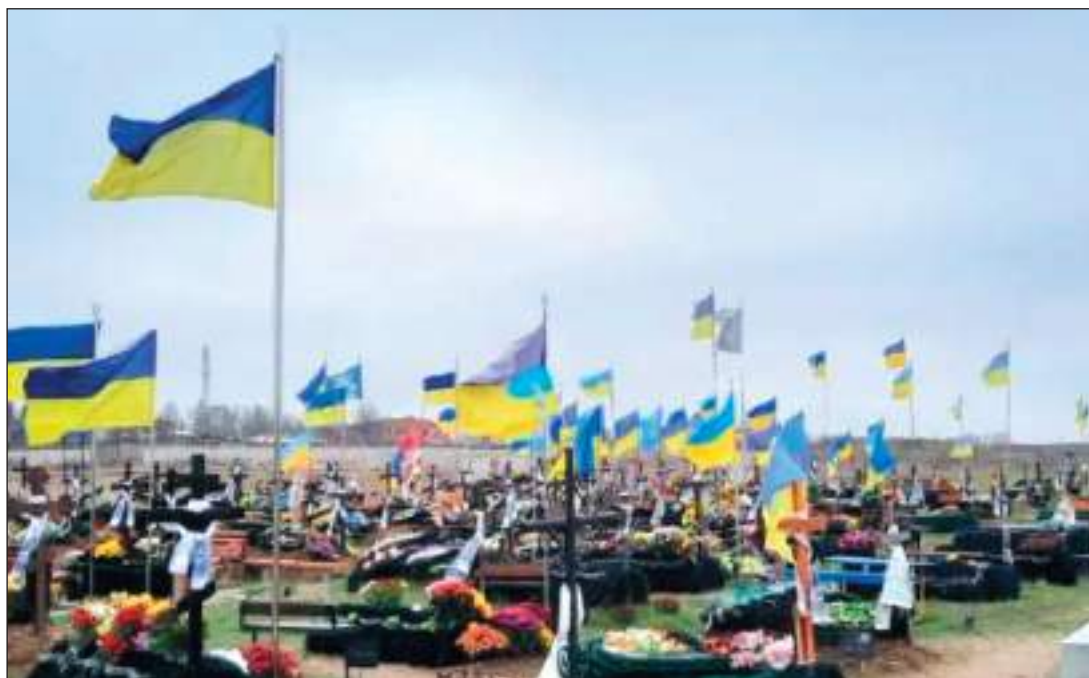
Алея Слави Героям АТО, Вінницький військово-медичний клінічний центр Центрального регіону, м. Вінниця