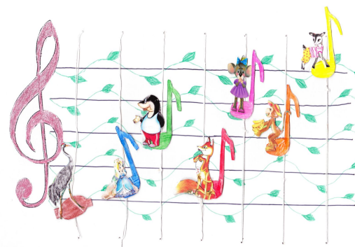
Рис.2. «Музично-ігрова діяльність»