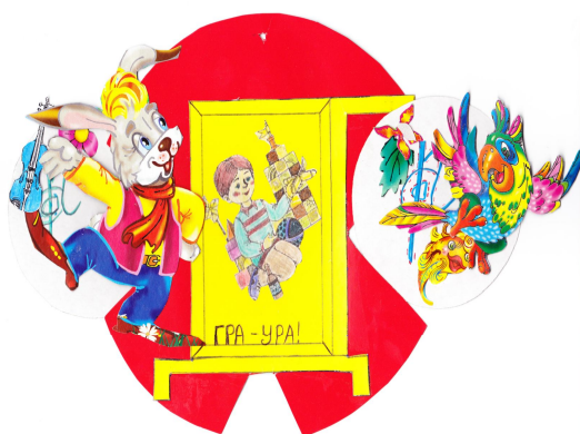
Рис.3. «Гра – ура!»