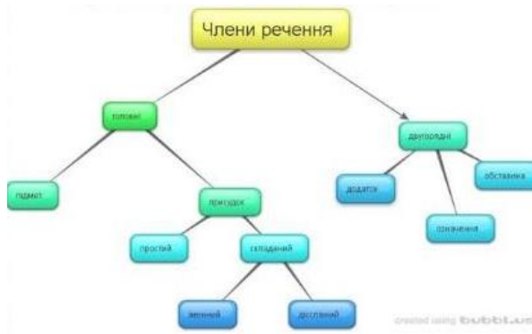
Рисунок 2. Метальна карта на уроці української мови

Ефективним засобом наочності під час дистанційного навчання є використання учителем ментальних / інтелектуальних карт. За твердженням дослідника В. Штейнберга, технології багатовимірних дидактичних інструментів полягають у запам'ятовуванні та осмисленні нового матеріалу через схеми та образи. Інша назва «ментальної карти» майндмеппінг (Mindmap) [Григор'єва 2020: 88] (рис. 2, 3)