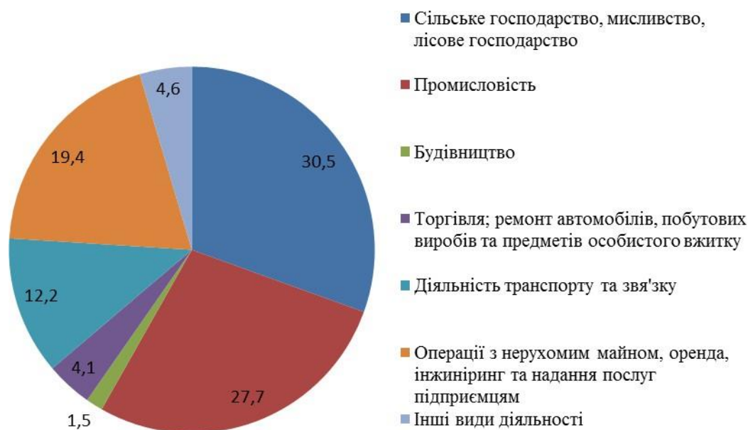
Рис. 2. Структура інвестицій в основний капітал за видами економічної діяльності у 2011 році

Зберігаються позитивні зрушення щодо інвестування сільського господарства, мисливства та лісового господарства, обсяги якого проти 2010 р. зросли у 2 рази, зросла також і питома вага капітальних вкладень у цей вид економічної діяльності і становить 30,5% від загального обсягу інвестицій (у 2010 р. – 22,7%) (рис. 2).