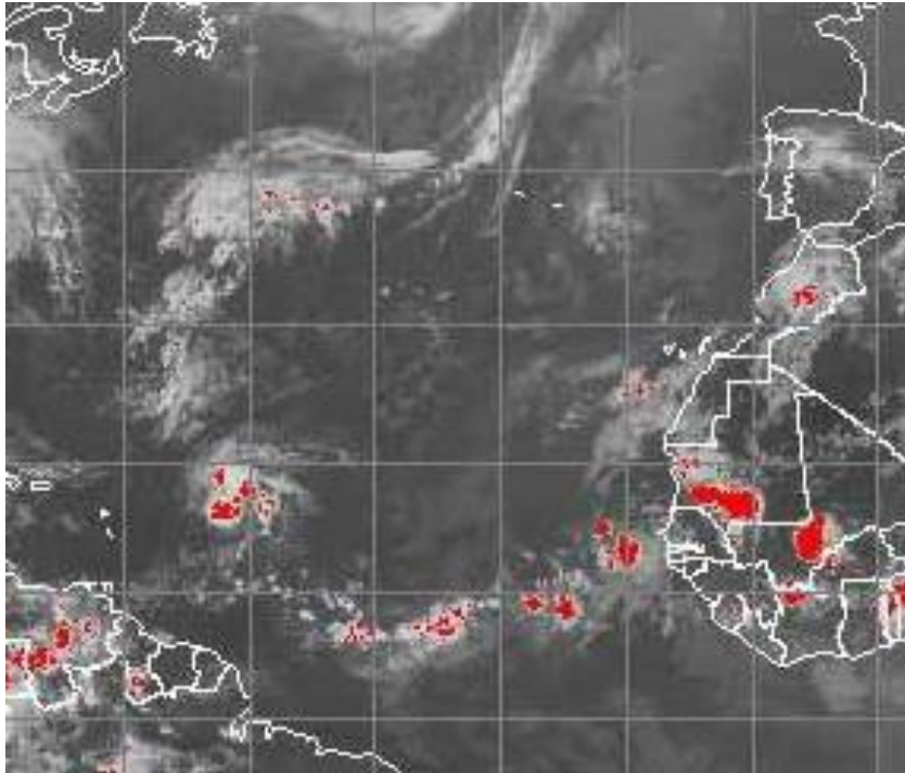
Рис. 1 „Надлом” ВЗК, та виникнення тропічного циклону у ВЗК над екваторіальною Атлантикою (2 вересня 2002 р.)