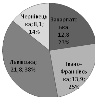
Рис. 1. Структура Карпатського регіону за площею (тис. км 2 , %). За [1].

Карпатський регіон займає 9,3 % площі України (56,6 тис. км 2 ), в ньому зосереджено 13,3 % (6,05 млн. осіб) населення нашої країни. Найбільшою в регіоні є Львівська область, що займає 38,5% за площею і 41,7 % за кількістю населення, найменшою є Чернівецька область – 14,3 % за площею і 14,9 % за кількістю населення (рис. 1).