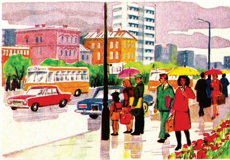
Рис. 1. Завдання: Look at the picture and answer the following questions.

1. Which of the four seasons is it? 2. Is the sky overcast with heavy clouds or is it clear and bright? 3. Has the sun gone in or is it shining brightly? 4. What is the ground covered with? 5. Are the fruit trees in blossom? 6. Do you see any flower-beds in the picture? 7. Who do you see in the picture? 8. What are the grown-up people doing? 9. What are the children doing? 10. Do people stay at home in spring or do they prefer to go out into the garden? 11. How do you like to spend your time in spring? 12. What is your favorite season? 13. What is difference between the season in your picture and your imagination of this season?