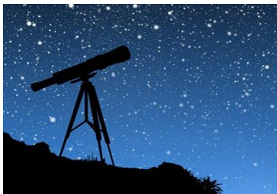
Рис. 1. Зоряне небо

Стівен Хокінг народився в Оксфорді, Великобританія. З самого дитинства він був дуже допитливим, за що і отримав прізвисько Ейнштейн. Навчався в Оксфордському університеті, потім перейшов до Кембриджу, для подальшого спеціалізування в області космології. Улюбленою стихією Стівена Хокінга була космологія і квантова гравітація. Він першим помітив, що чорні діри можуть зникати, тобто випаровуватися. У 1960-х Хокінг працював над загальною теорією відносності. Навчався в Оксфордському університеті, отримав ступінь доктора філософії з дисертацією на тему: «Властивості розширення Всесвітів», за яку уже в 24 роки отримав доктора наук. А в 1979 році став професором математики. Попри важку хворобу (параліч) вчений жив повноцінним життям, читав лекції для студентів, влаштував особисте життя та постійно займався науковими дослідженнями [3, 4, 5].