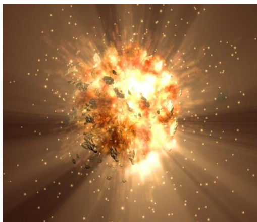
Рис. 3. Великий Вибух

Стівен Хокінг намагався розібратися з питанням: Що було до Великого Вибуху? І почав він з того, що запропонував відмотати час, приблизно, на 13,7 млрд років назад. Так він вважав, що до Великого Вибуху Всесвіту не існувало, а він сам був розміром з атом (рис. 3). "Гранична умова Всесвіту ... полягає в тому, що у неї немає меж", - сказав Хокінг. Він пропонує "перемотати назад" розвиток Всесвіту. "Так як ви рухаєтеся назад в часі, для вас Всесвіт стискається. Перемотайте досить далеко (близько 13,8 мільярдів років), і весь Всесвіт стиснеться до розміру одного атома", - сказав Хокінг. Усередині цієї надзвичайно маленької, масивної, щільної плями теплота і енергії, закони фізики і часу, як ми їх знаємо, перестають функціонувати.