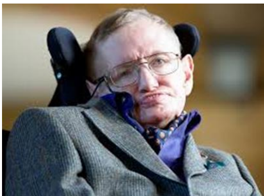
Рис. 2. Стівен Хокінг

випустив книжку для дітей «Джордж і таємниці Всесвіту». Крім написання книг, з'являвся образ Стівена Хокінга в серіалах «Сімпсони», «Зоряний шлях», «Теорія усього», та «Теорія Великого Вибуху», в якому він зіграв сам себе. Взяв участь у записі альбому культового рок-гурту Pink Floyd. Також, за своє життя він зібрав чимало нагород: у 1974 році став членом Лондонського королівського товариства, у 1979 став Лукасовським професором математики, у 1982 був удостоєний звання командора ордена Британської імперії та з 1992 був членом Американської академії наук [3, 5].