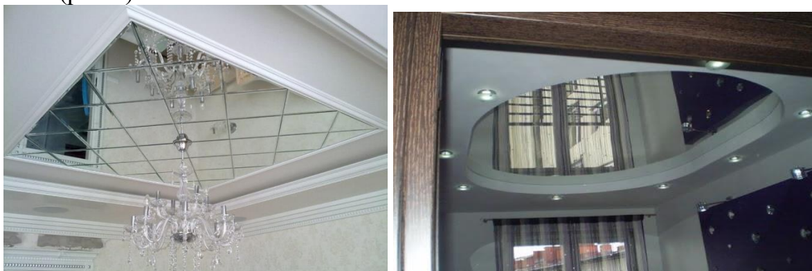
Рис. 2. Використання дзеркальних вставок на стелі

Використання дзеркала в якості оздоблювального матеріалу вимагає не тільки знання особливостей, адже дзеркало – дуже активний елемент в оздобленні інтер'єру, і необережне його використання може створити масу проблем. Дзеркальні стельові вставки – досить популярний варіант декору інтер'єру. Кімната з такою стелею стає візуально набагато просторішою і світлішою (рис.2).