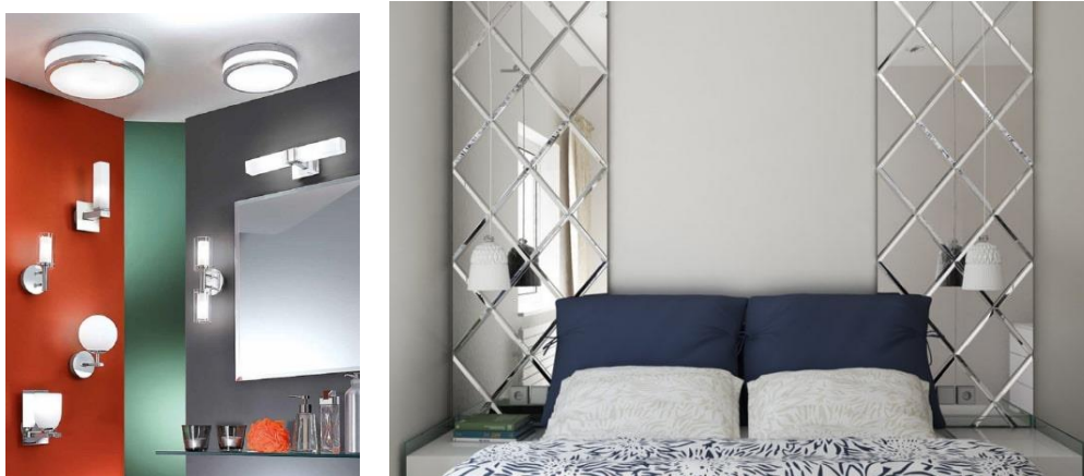
Рис.1. Розміщення дзеркал біля джерел світла

дасть кімнаті більше освітленості і повітря. Можна використовувати гладкі дзеркальні панелі, розташовані під різним кутом по відношенню один до одного, щоб створити калейдоскопічний ефект.