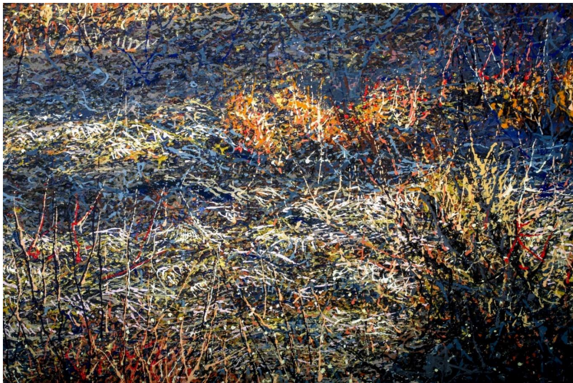
Іван Марчук. Із серії картин «Ранкові заморозки». 2005 р.