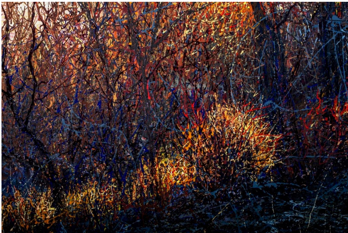
Іван Марчук. Із серії картин «Ранкові заморозки». 2005 р.