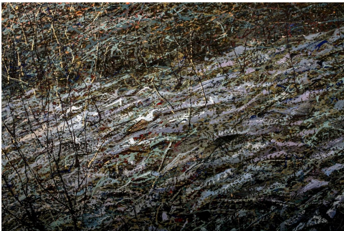
Іван Марчук. Із серії картин «Ранкові заморозки». 2005 р.

Відтак, пльонтанізм Івана Марчука є оригінальним явищем у мистецтві, і його вивчення, як і дослідження постаті власне художника залишається відкритою темою для дослідників сучасного українського образотворчого мистецтва.