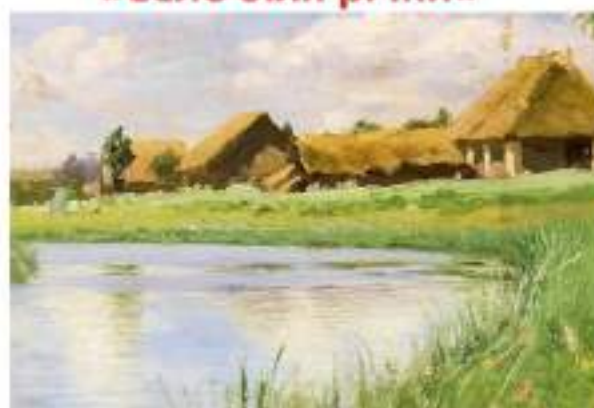
«Село біля річки»