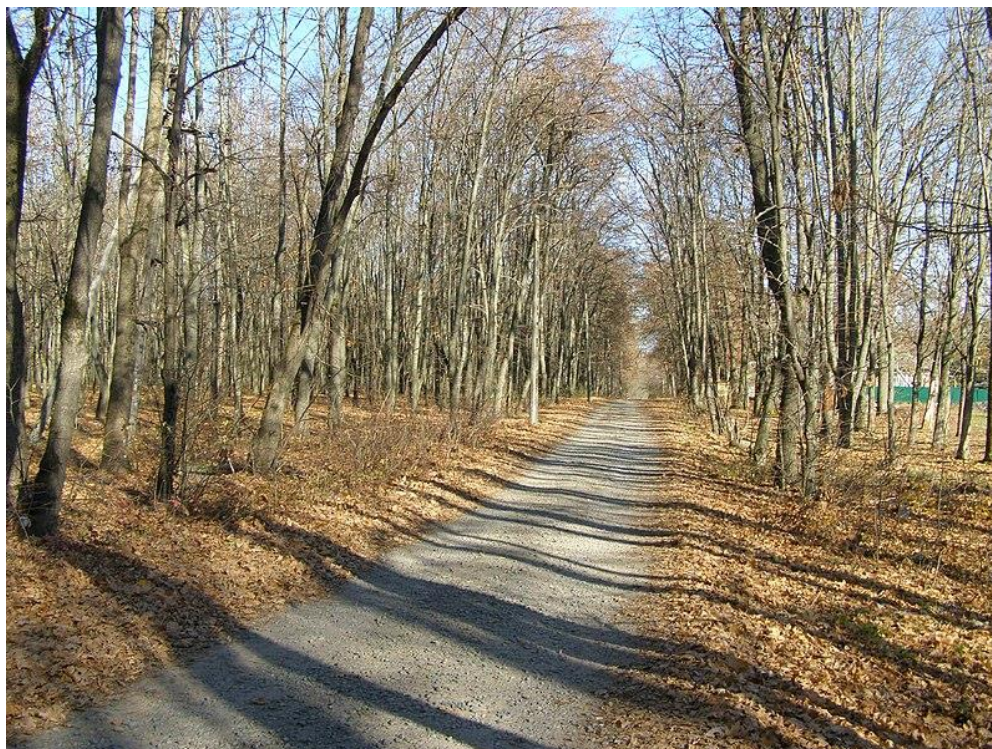
Фото 3.3. Покровський парк

інших рослин. Серед трав'яного покриву переважає зірочник ланцетолістий, трохи рідше зростає яглиця звичайна. Загалом у ботанічній пам'ятці природи зростає понад 60 різних форм та видів деревних порід [100].