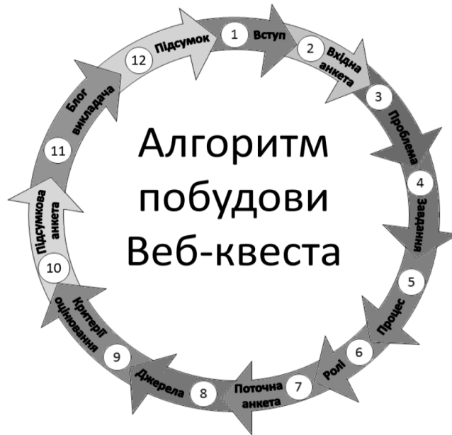
Рис. 3. Алгоритм побудови (виконання) Веб-квеста