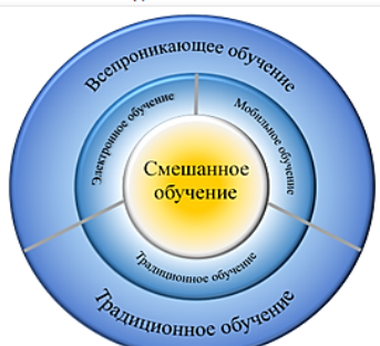
Рис. 6. Веб-сторінка Блог-квеста «Сучасні технології навчання»

Враховуючи, що найбільшого використання в навчанні нині отримала модель змішаного навчання, наведемо схему можливого її здійснення.