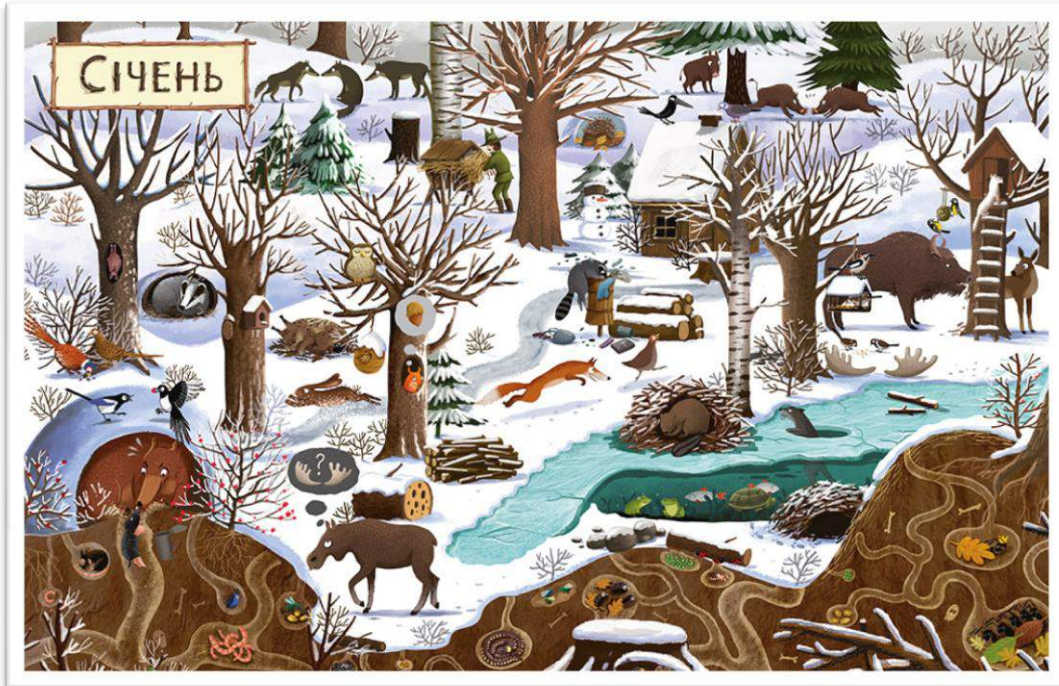
Репродукція картини-вімельбуха зими «Рік у лісі»

- Яких тварин ви впізнали на картинці? Як вони пристосувалися до зими? Які тварини лягають у сплячку? Які взимку не сплять, а навпаки пристосовуються до холодів та шукають поживу? А що робить людина на даному зображенні? Так, вона підгодовує тварин: у великі годівниці кладе сіно, капусту, моркву для лося, дикого кабана, зайця, білочки; для птахів у маленькі годівнички насипає зерно, крихти хліба.