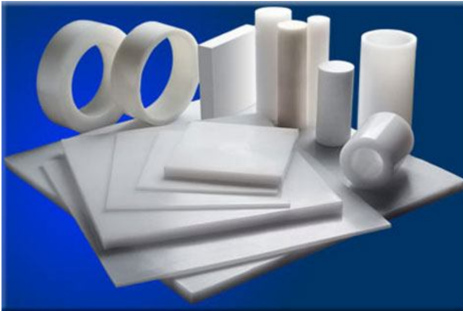
Рис. 2. Тефлон

Найменування "Teflon" належить концерну Du Pont, який в числі перших почав виробляти предмети побуту на базі даного полімеру.