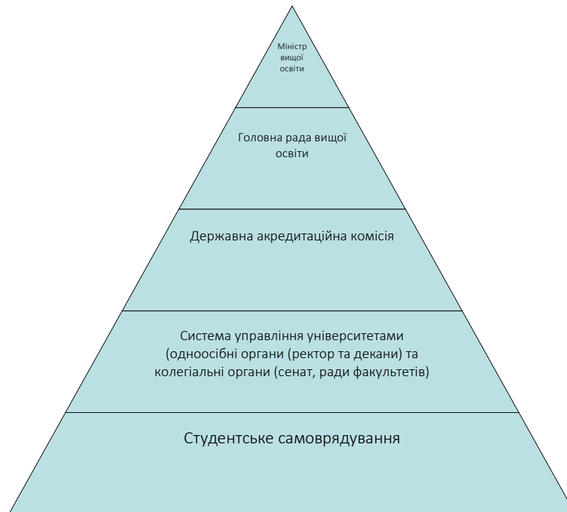
Рис. 3.1. Рівні управління вищою освітою Польщі за Законом про вищу освіту 1990 р.

закладів вищої освіти з активним залученням представників університетів, наукових асоціацій, професійних і творчих організацій, а також організацій роботодавців до складу Головної ради вищої освіти та Державної акредитаційної комісії.