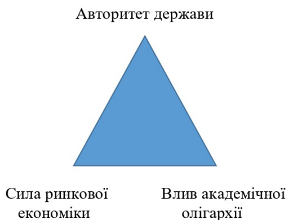
Рис. 1.1. Модель управління ЗВО у різних національних системах Бертон Р. Кларка «трикутник владних відносин» (трикутник координації)

На прикладі різних країн він показав функціонування трикутника координації. Так, він стверджував, що на той час найближче до моделі ринкового впливу знаходились США, до влади (сили) – СРСР і Швеція, до влади академічної олігархії – Італія та Великобританія. Окрім того, згодом Кларк запропонував вдосконалити цю модель управління (координації) з урахуванням поділу влади, підтримці різноманітності, узаконення безладу, унікальності вищої освіти [12].