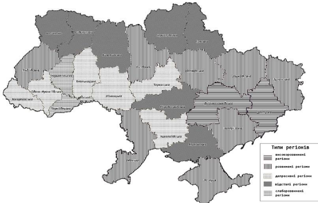
Рис. 2. Типи регіонів

Виконуючи поставлене завдання, – типізації регіонів за поєднаною системою рівня розвитку і загальним потенціалом регіону, враховуючи попередні авторські дослідження, характеристику різних варіантів груп регіонів, ми передбачаємо дві ситуації. Перша – певна група виявиться надто відмінною від інших, друга ситуація – групи мають багато спільних характеристик і ми маємо право їх об'єднати. Тому, враховуючи вищезазначене, на основі виділених груп регіонів, наукового аналізу існуючих підходів та авторського бачення проблем регіонального розвитку, нами було виділено в межах України п'ять типів регіонів (рис. 2).