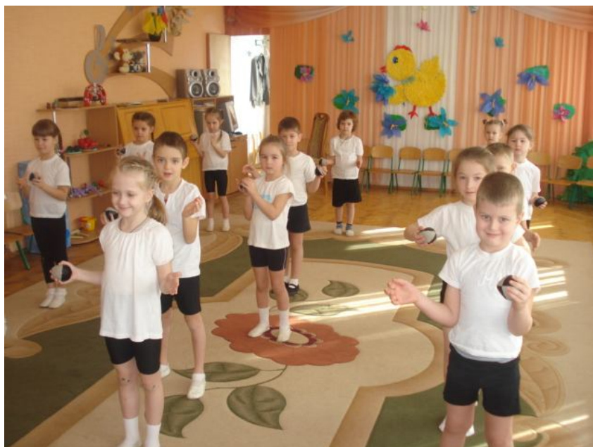
Рис.1. Виконання вправ з ботмерівськими м'ячами дітьми старшого дошкільного віку ДНЗ№30 «Світлячок» м. Вінниця.

попередньо обжареною крупою; вправи з одним м'ячем є підвідними до вправ з двома та більше м'ячами, які виконуються в парі та колективно.