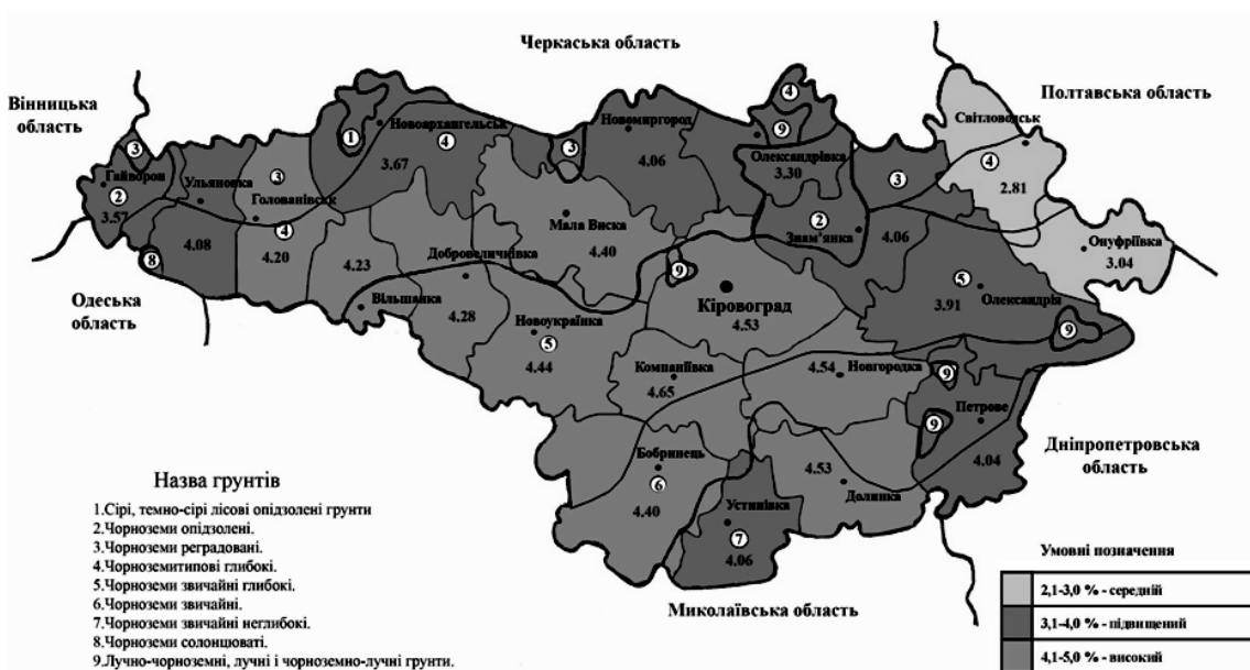
Рис. 1. Вміст гумусу в ґрунтах Кіровоградської області

Олександрійському адміністративних районах запаси гумусу помітно зменшуються і не перевищують 4%. Найбіднішими за вмістом гумусу (в середньому 2,8-3,0%) є легкі за механічним складом ґрунти Придніпров'я (Світловодський та Онуфріївський райони), де до того ж найбільш розвинені ерозійні процеси (рис 1).