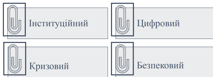
Рис. 3.1. Рівні реалізації державної комунікативної політики

Умови повномасштабної воєнної агресії та суспільно-політичної кризи в Україні зумовили кардинальну трансформацію державної комунікативної політики, яка перетворилася на один із ключових інструментів забезпечення національної безпеки. Її реалізація сьогодні охоплює декілька рівнів, які функціонують у режимі постійної інформаційної взаємодії між державою та суспільством (рис. 3.1.).