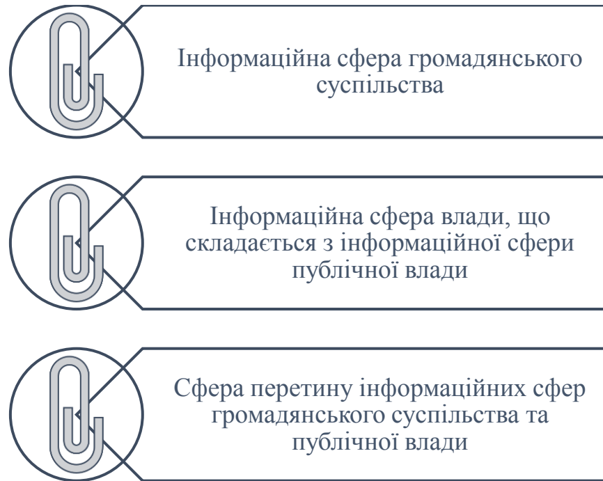
Рис. 2.1. Сфери взаємодії суспільства та органів публічної влади в інформаційній галузі

Враховуючи, що інформаційний простір держави, у якому реалізуються процеси інформаційної взаємодії, передусім, формується взаємодією громадянського суспільства та органів публічної влади, як ключові об'єкти регулювання державної комунікативної політики та інструменти публічного управління можна виділити окремі сфери цієї взаємодії (рис. 2.1.).