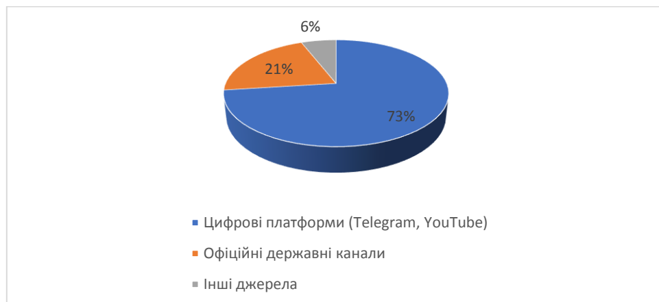
Рис. 3.2. Розподіл основних джерел отримання новин серед населення України

Проілюструймо наведені у таблиці 3.1. дані на рисунку 3.2.