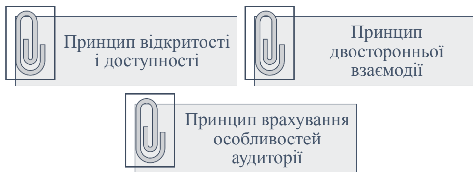
Рис. 1.1. Принципи державної комунікативної політики

Реалізація державної комунікативної політики базується на певних принципах, які визначають ефективність обміну інформацією між органами влади та громадянами (рис. 1.1.).