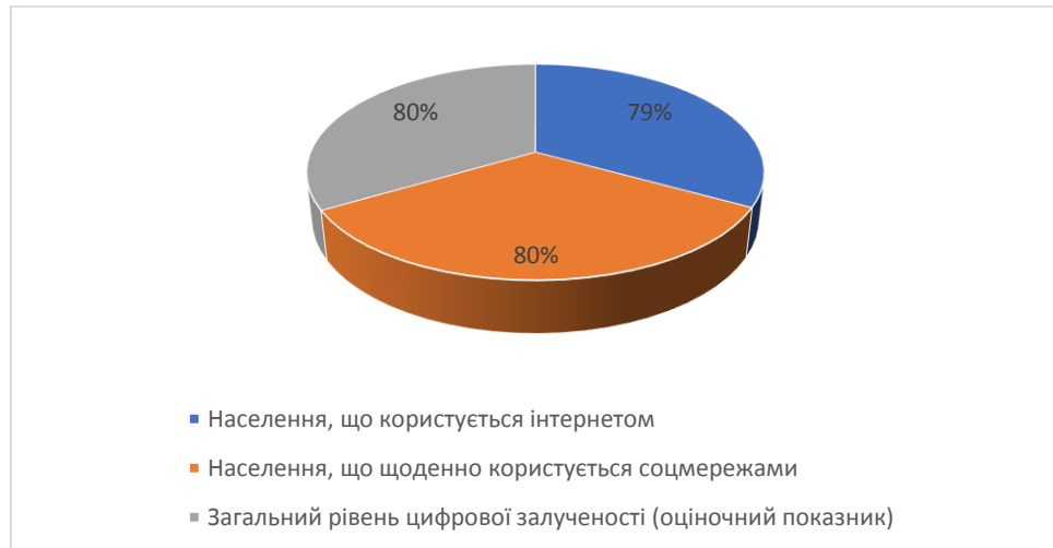
Рис. 3.3. Рівень цифрової інтеграції населення України

Проілюструймо наведені у таблиці 3.2. дані на рисунку 3.3.