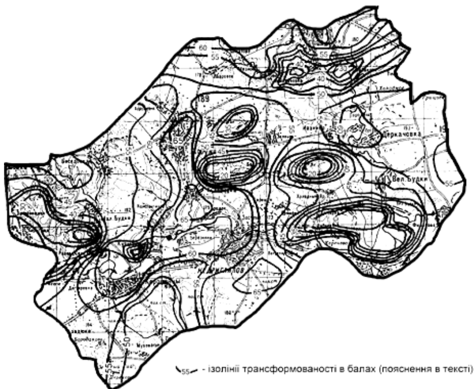
Рис.2. Антропогенна трансформованість ландшафтів Верхнього Посулля тектогенних ландшафтах Левобережной Украины // Материалы Харьк. отдела Геогр. общ-ва Украины. - 1968.- Вып. 6.- С.61-70. 3. Гродзинський М.Д. Стійкість геосистем до антропогенних навантажень. - К.: Лікей, 1995.-