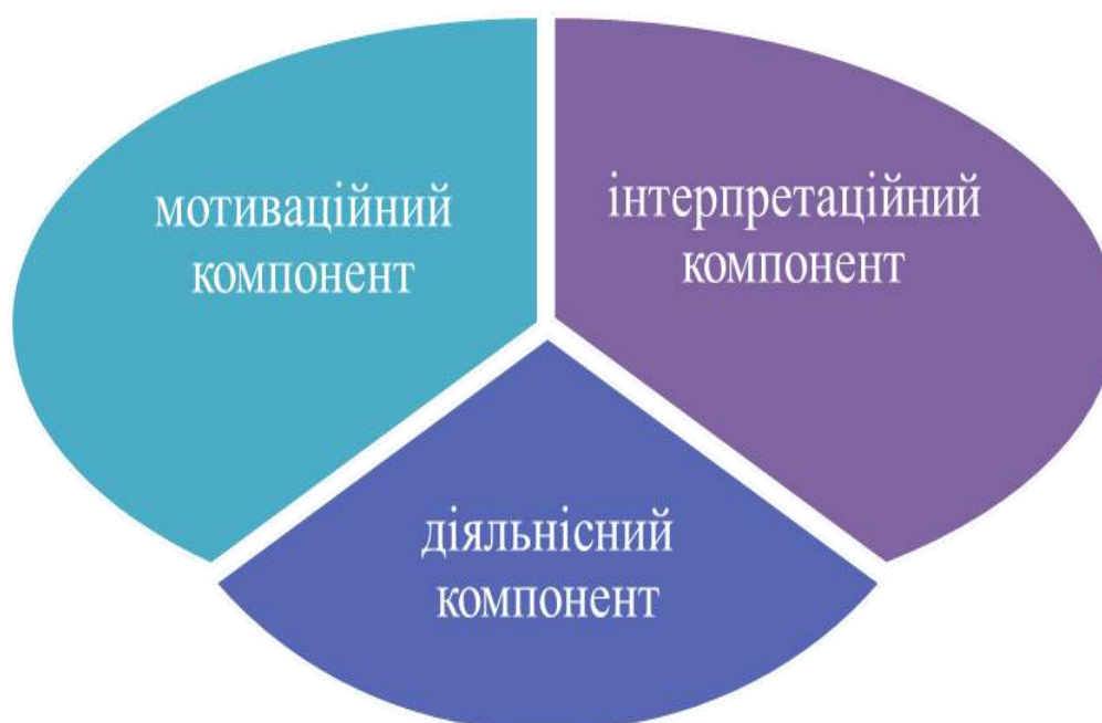
Рис. 2.1. Структура готовності майбутніх учителів початкової школи до інтегрованого викладання мистецьких дисциплін

Мотиваційний компонент поєднує мотиви, інтерес і потреби майбутнього вчителя у використанні інтегративних зв'язків для навчання, виховання й розвитку молодшого школяра, реалізації його здібностей і можливостей; акумулює ціннісні орієнтації та особистісні якості вчителя, бажання досягти ефективного результату; активізує прагнення до творчого пошуку.