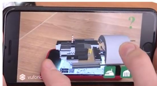
Рис. 3. Приклад використання додатку Chornobyl NPP ARCH AR

Результатами навчально-пізнавальної діяльності учнів у ході виконання навчальних проєктів мають бути знанневий компонент (знають принцип дії ядерного реактора, знають про вплив радіоактивного випромінювання на живі організми); діяльнісний компонент (пояснюють іонізаційну дію радіоактивного випромінювання, користуються дозиметром (за наявності), використовують набуті знання для безпечної життєдіяльності), ціннісний компонент (усвідомлюють переваги, недоліки і перспективи розвитку атомної енергетики, можливості використання термоядерного синтезу, оцінюють доцільність використання атомної енергетики та її вплив на екологію, ефективність методів захисту від впливу радіоактивного випромінювання) [25].