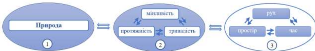
Рис. 1. Рух, простір і час як якості матеріального світу і як наукові поняття: 1 – природа як реальність; 2 – якості (прояви) матеріального світу; 3 – як загальнонаукові поняття.

Рух, простір та час у їх поєднанні варто розглядати в координатах виміру «природа – людина – бачення світу» (Рис. 1).