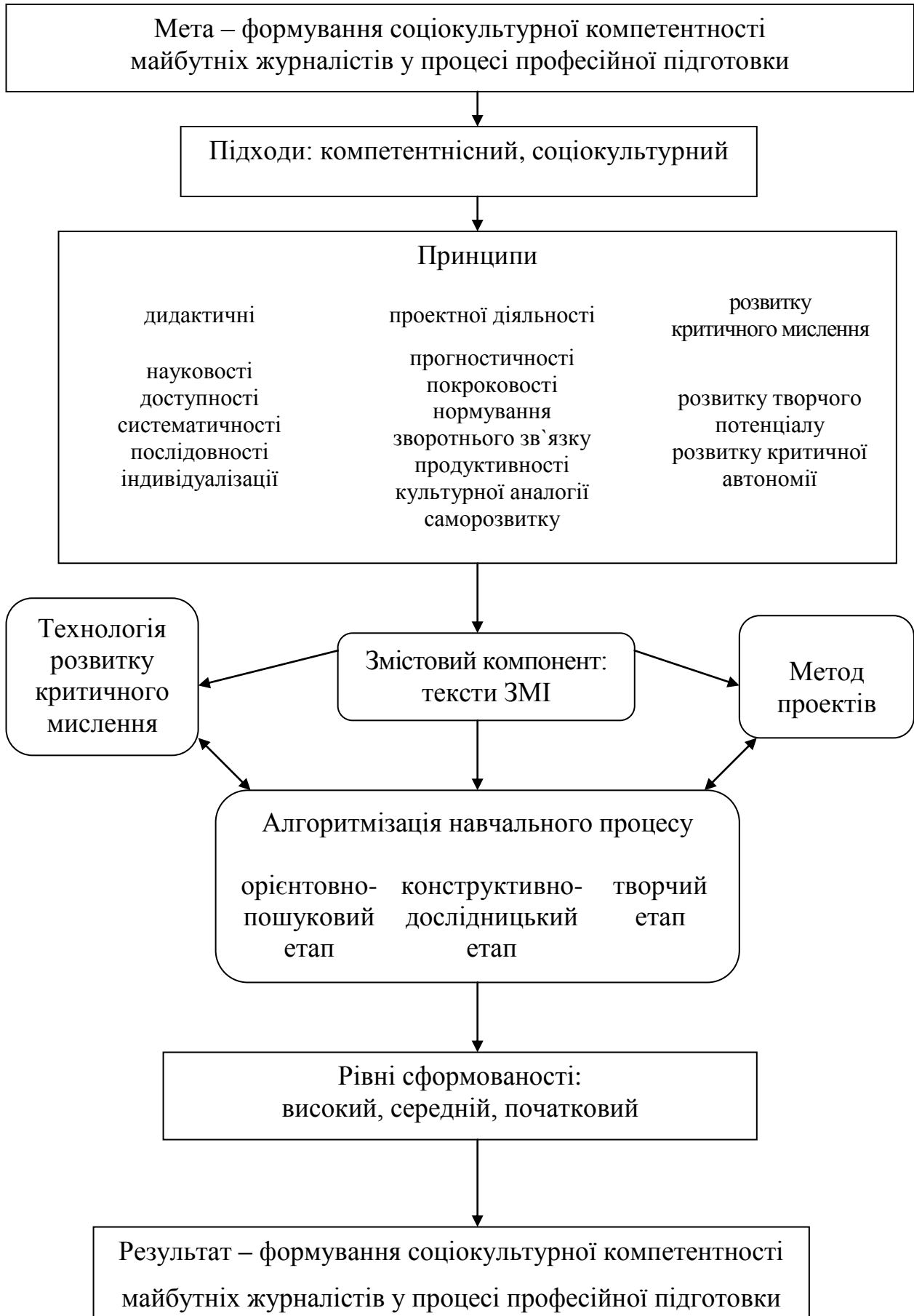
Рис. 1. Педагогічна модель формування соціокультурної компетентності майбутніх журналістів у процесі професійної підготовки