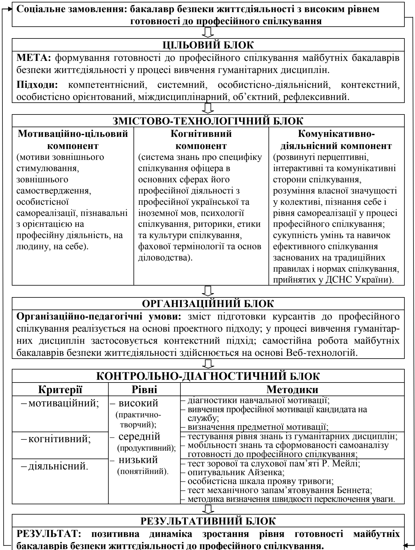
Рис. 1. Модель формування готовності до професійного спілкування майбутніх бакалаврів безпеки життєдіяльності у процесі вивчення гуманітарних дисциплін