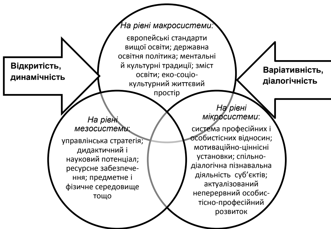
Рис. 2. Складові й особливості екологічності освітнього середовища вищого навчального закладу.

Висновки і перспективи подальших досліджень. У контексті моделювання екологічно орієнтованого й неперервного простору освіти (у континуумі неформальна освіта – формальна освіта – інформальна освіта) на перспективу наукових досліджень потребують конкретизації, на нашу думку, сутність, особливості, динаміка професійної підготовки майбутніх фахівців в єдності її когнітивного, мотиваційно-ціннісного й операційно-діяльнісного компонентів. Ключовим пріоритетом і парадигмальним вектором в умовах вибудови екологічності освітнього середовища має стати „Я” суб'єктів особистісно-професійного розвитку в усьому розмаїті численних контактів і взаємовпливів, запитів і потреб, можливостей і потенцій. Така діалогічність стане не лише основою для накопичення студентами позитивного досвіду розв'язання різноманітних професійних і життєвих завдань, а й запорукою гуманізації, рефлексивності, відкритості, результативності й інноваційності освітнього простору загалом.