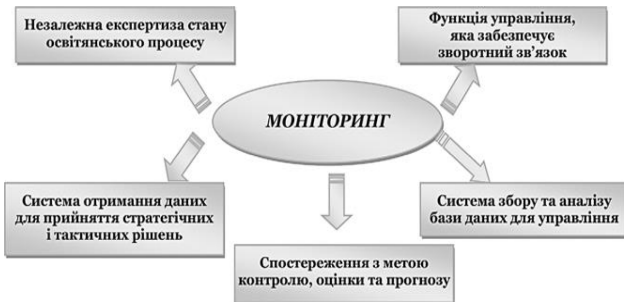
Рис. 2. Загальна структура моніторингу

Структуру моніторингу демонструє рис. 2.