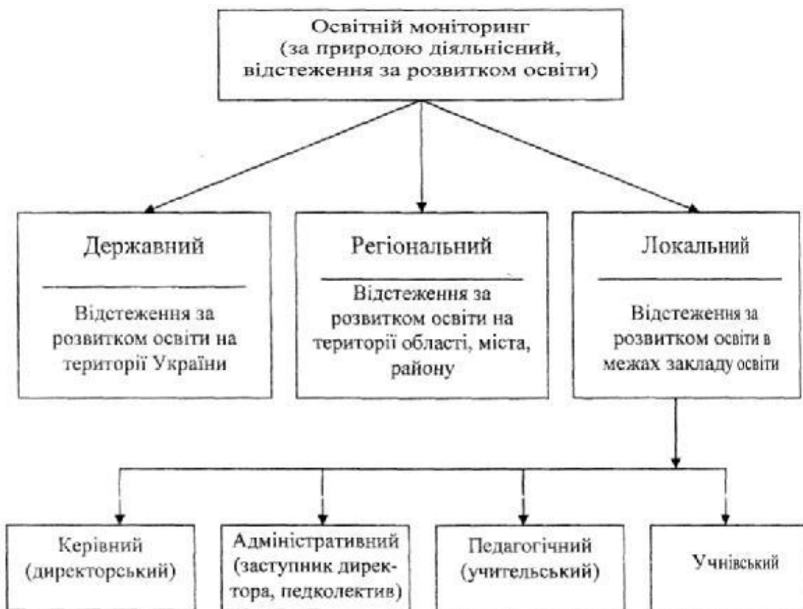
Рис. 3. Класифікація видів освітнього моніторингу за об'єктами відстеження

В основу класифікацій видів моніторингу можуть бути покладені різні складові, до яких належать: