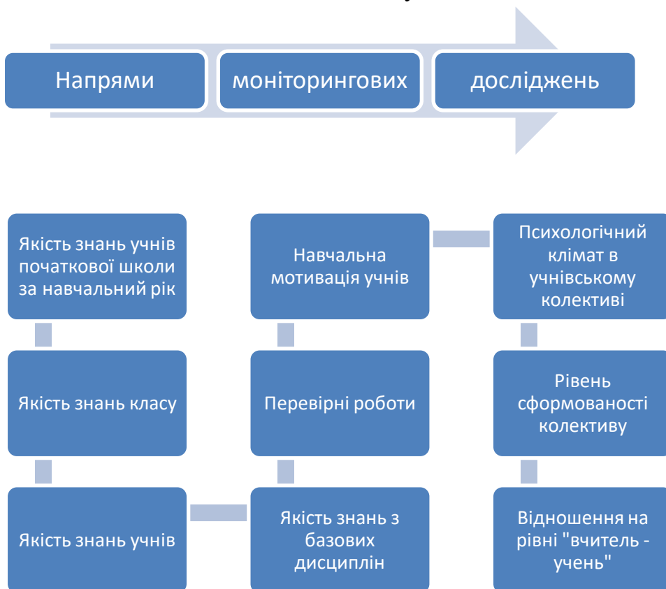
Рис 5 . Напрями моніторингових досліджень

Інформація про стан засвоєння навчального матеріалу класом в цілому та окремими учнями зокрема допомагає вчителю правильно обирати методи навчання й повніше здійснювати індивідуальний підхід.