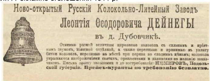
Ил.8. Рекламне оголошення 1912 р.