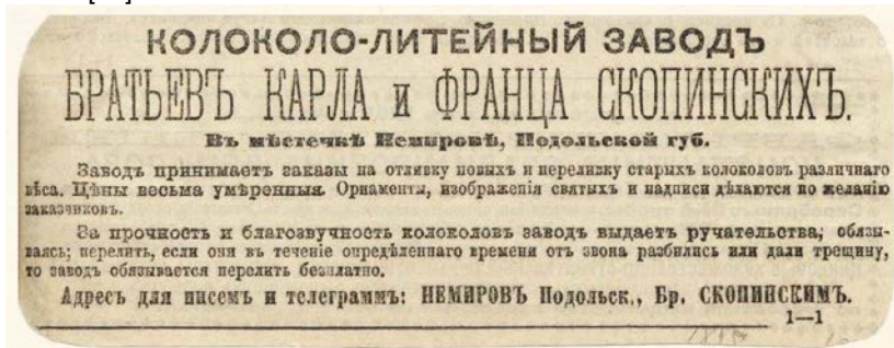
Іл.1. Рекламне оголошення 1895 р.

Реклами дзвоноливарних заводів Немирова та околиць кін. ХІХ – поч. ХХ ст. [20]