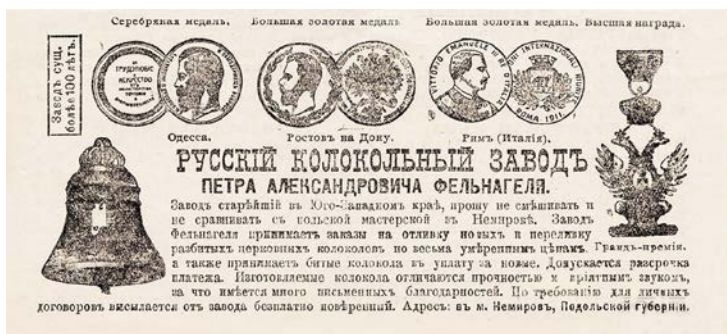
Ил.5. Рекламне оголошення 1913 р.