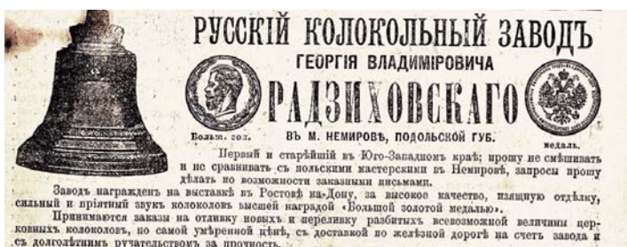
Ил.7. Рекламне оголошення 1911 р.