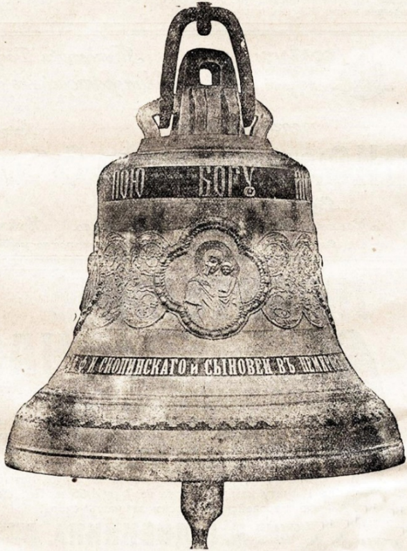
Ил.2. Рекламне оголошення 1914 р.

Принимаетъ заказы по всей Россійской Имперіи на церковные различн. величины колокола, которые отличаются сильнымъ и приятнымъ звукомъ, прочностью и изысканной отдѣлкой. Колокола изготовляются изъ высокаго качества матеріала, и за прочность ихъ выдана письменное ручательство на продолжительное время. За добросовѣстное исполненіе заказовъ нашъ заводъ пользуется давнишней извѣстностью, имѣетъ громадный сбытъ по всей Россійской Имперіи и заслужилъ множество письменныхъ благодарностей. Принимаетъ въ уплату за новые старые битые колокола, также соглашается переливать битые колокола на мѣстѣ заказа по заводской цѣнѣ. На заводѣ имѣются для продажи готовые колокола разнаго вѣса; для полнаго хора могутъ быть подобраны подъ камертонъ. Цѣны доступнѣе другихъ заводовъ. Допускается разсрочка платежа. По требов. подробныя условія высыл. безплатно, или посылается пофреншій.