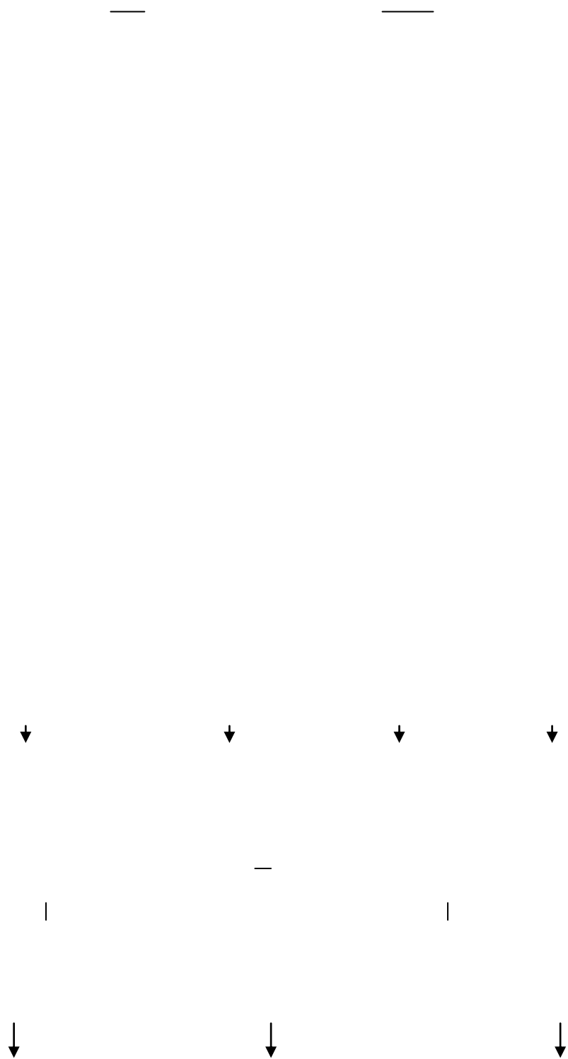
Рис 1. Структурно-функціональна модель ефективної організації діяльності ліцею у сільській місцевості.