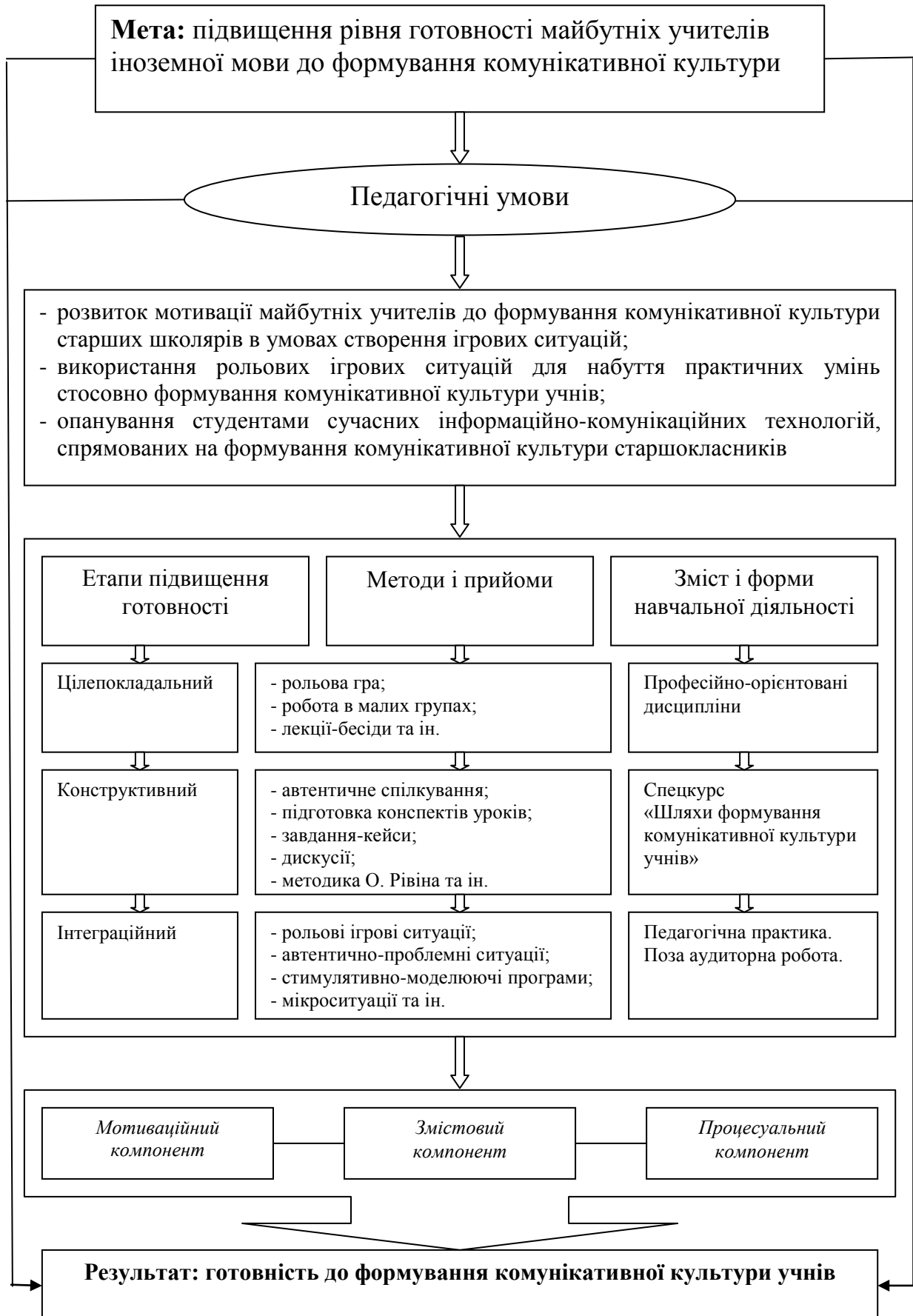
Рис. 1. Організаційно-методична модель підвищення рівня готовності майбутніх учителів іноземної мови до формування комунікативної культури старших учнів